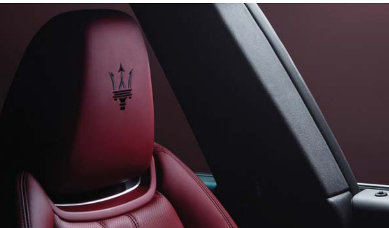
Levante - Headrest detail