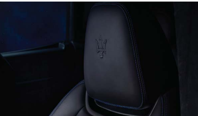
Levante GT Hybrid - Headrest detail