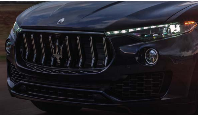
Levante GT Hybrid - Grille

르반떼 GT 하이브리드는 향상된 효율성과 더불어, 퍼포먼스와 스타일을 새로운 수준으로 올려놓은 SUV의 마세라티입니다. 감동을 주는, 전동화된, 완벽한 마세라티의 포효를 갖춘 SUV의 마세라티. 신형 르반떼에 탑재된 하이브리드 기술은 앞으로 여러분이 도전할 모험이 더욱 즐거울 수 있도록 설계되었습니다. 한계를 모른 채, 언제나 당신을 더 멀리 나아가게 해 줄 위대한 마세라티 퍼포먼스와 함께 새로운 길을 향해 나아 갑니다. 르반떼 GT 하이브리드는 0-100 km/h 를 6초에 돌파하며, 최고속도는 245 km/h에 달합니다. 이름 그대로의 마일드 하이브리드 기술의 명성, 언제나 함께 할 포효하는 마세라티 파워. 하이브리드 시스템은 350 마력 V6 가솔린 버전에 비해 연비를 18% 이상 절약하면서도 동일한 수준의 성능을 발휘합니다.