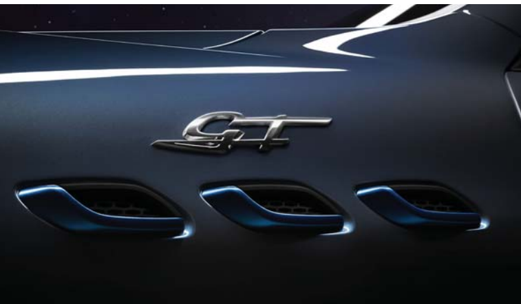
Levante GT Hybrid - Side air vents and GT Badge