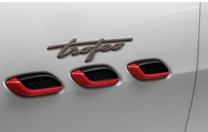
Levante Trofeo - Side air vents and Trofeo Badge