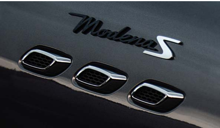
Levante - Side air vents and Modena Badge

진정한 마세라티 그랜드 투어링 전통 그대로, 르반떼는 으르렁 대며 차고 나가는 민첩한 응답성부터 장거리에도 거뜰한 정제된 고속 주행 성능까지, 마세라티에 기대하는 모든 것을 제공합니다. 르반떼의 인상적인 SUV 비율은 기품이 느껴지는 라인과 르반떼의 역동성을 한 눈에 드러낸 근육질의 형태와 완벽한 균형을 이룹니다. 새시의 무게 중심을 최대한 낮게 설정해 최고속도에도 노면에 달라 붙어 미끄러져 나가는 느낌을 선사하고, 완벽히 균형을 이룬 무게 배분은 공기역학적인 보디로 이어집니다. 탁월한 온-로드 퍼포먼스와 오프-로드 능력의 결합.