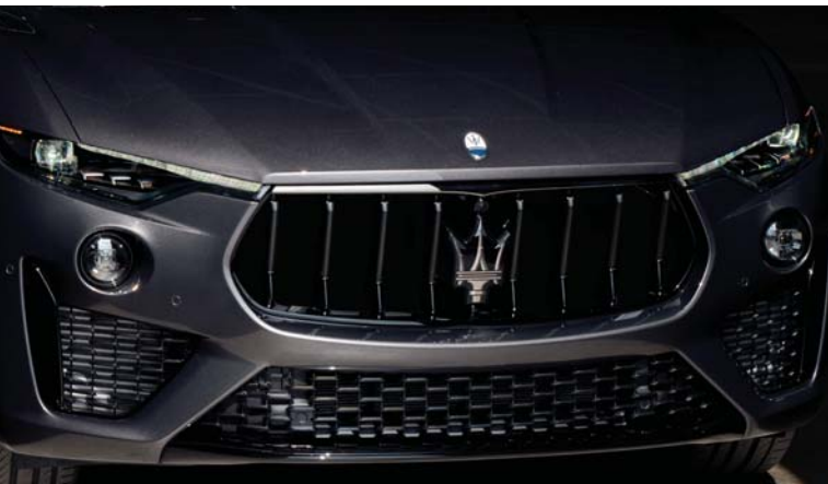
Levante - Grille