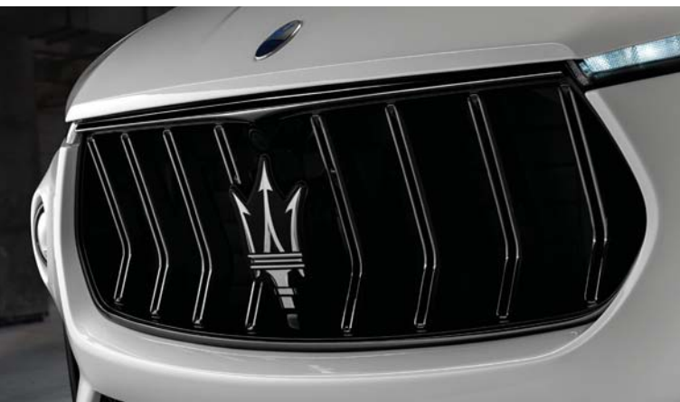
Levante Trofeo - Grille