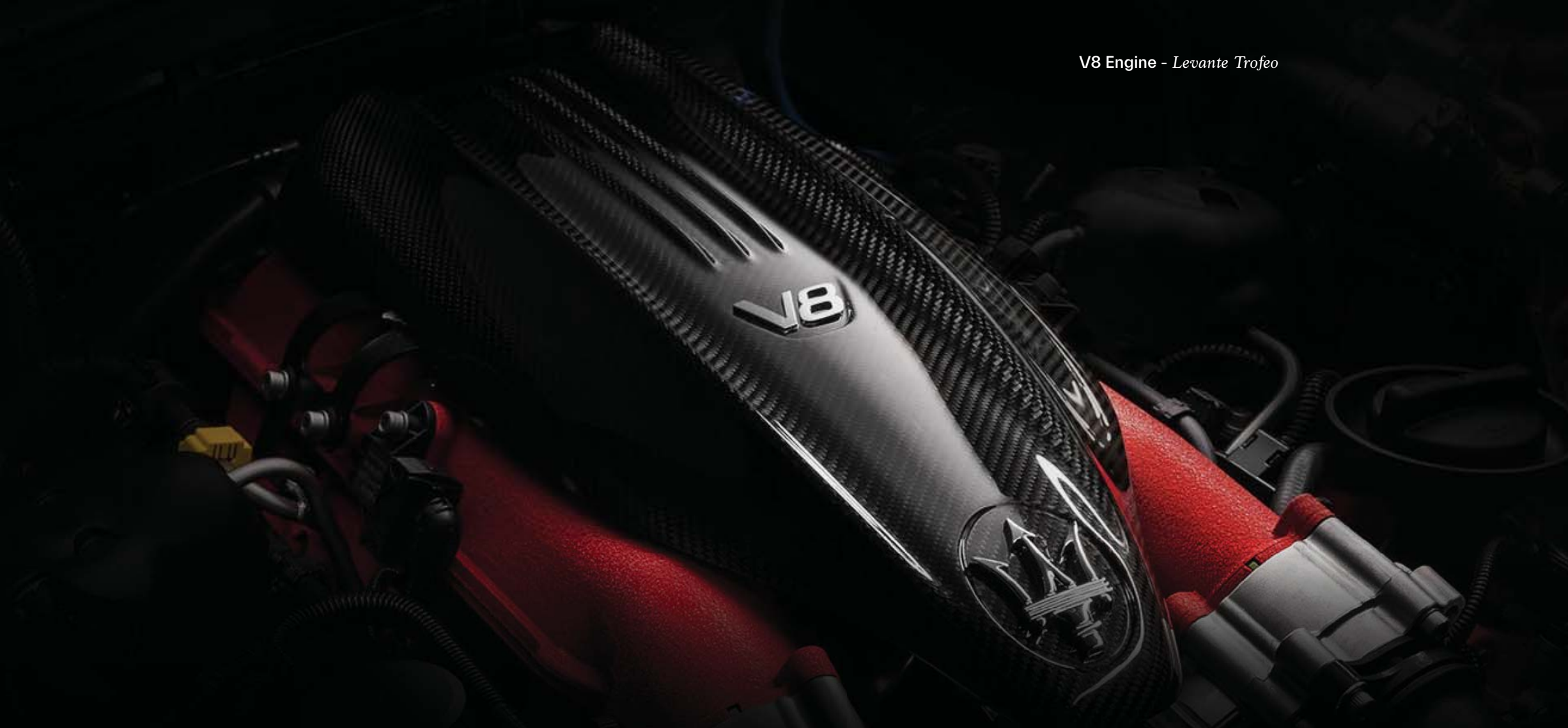
V8 Engine - Levante Trofeo

각 르반떼 버전에 탑재된 엔진들은 단숨에 으르렁대며 차고 나가는 응답성, 정제된 장거리 고속 주행 성능에 이르기까지 마세라티에 기대하는 모든 것을 만족 시켜줍니다. 게다가 효율적이기까지 합니다.