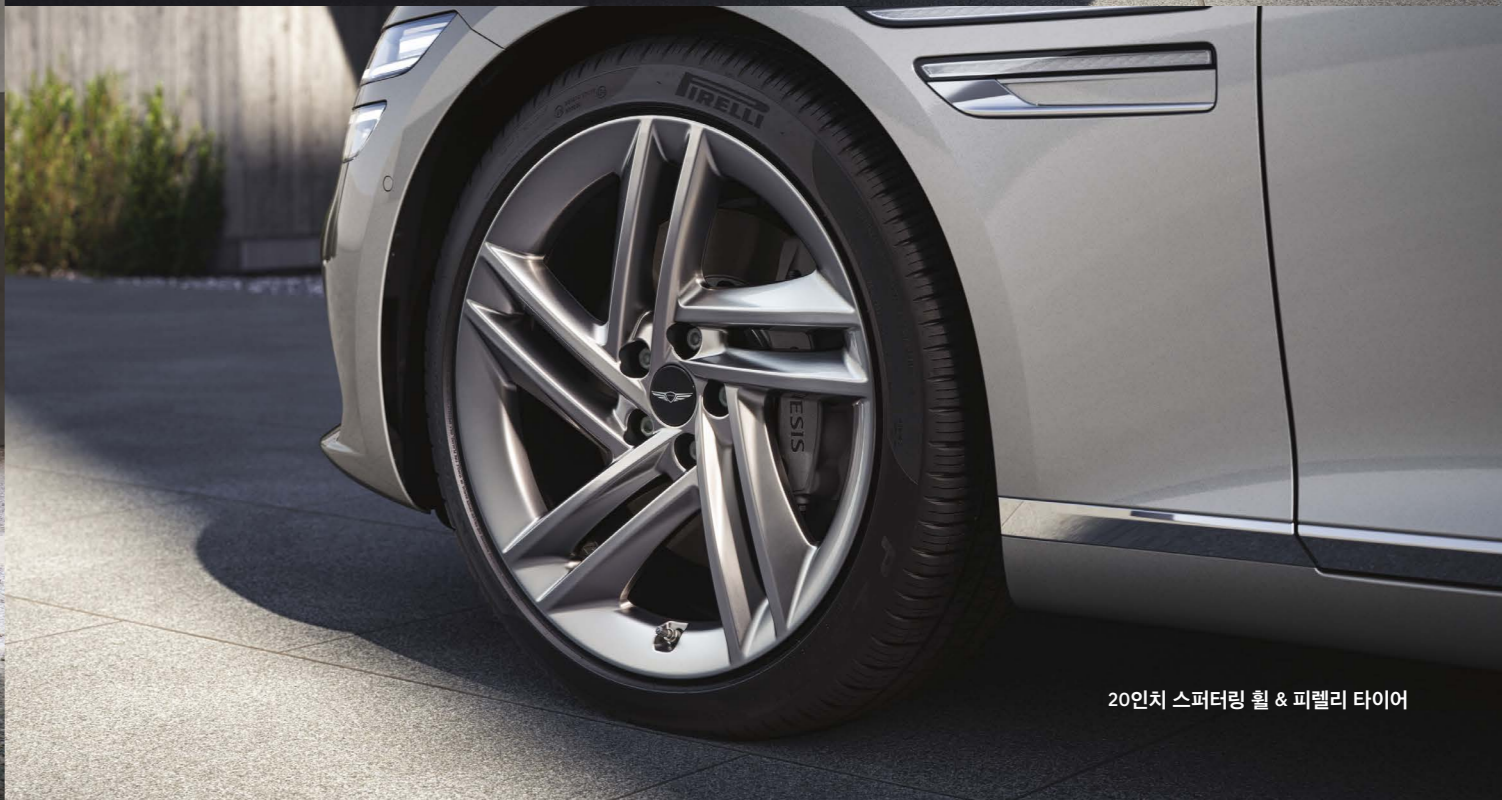
20인치 스퍼터링 휠 & 피렐리 타이어