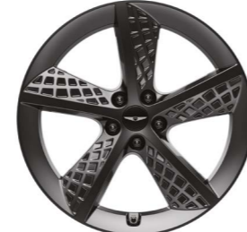
20인치 다크 스퍼터링 휠 *스포츠 전용