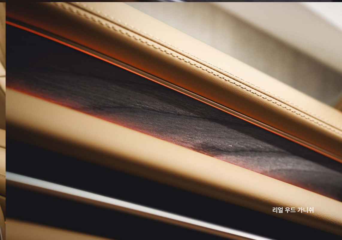
리얼 우드 가니쉬