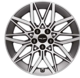
18인치 다이아몬드 커팅 휠