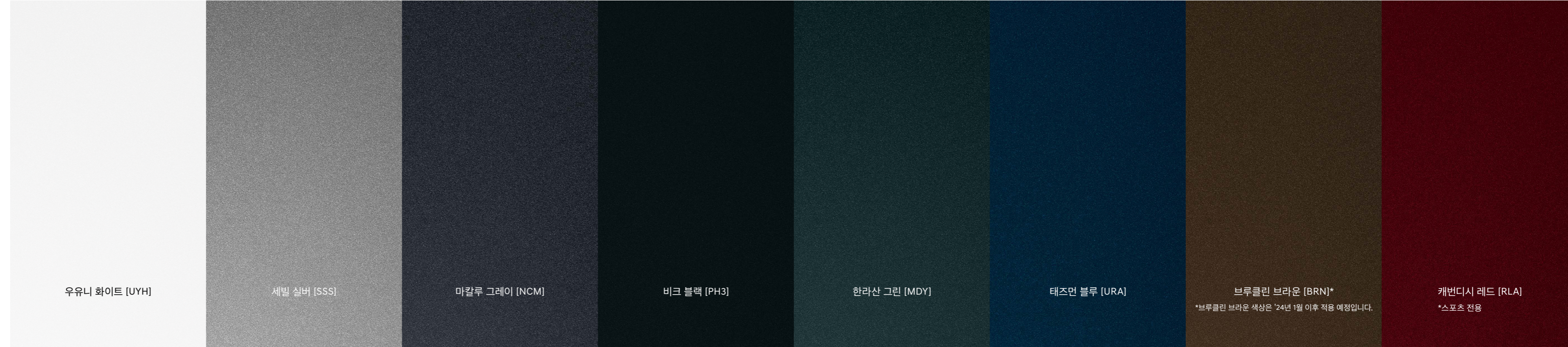
우유니 화이트 [UYH]