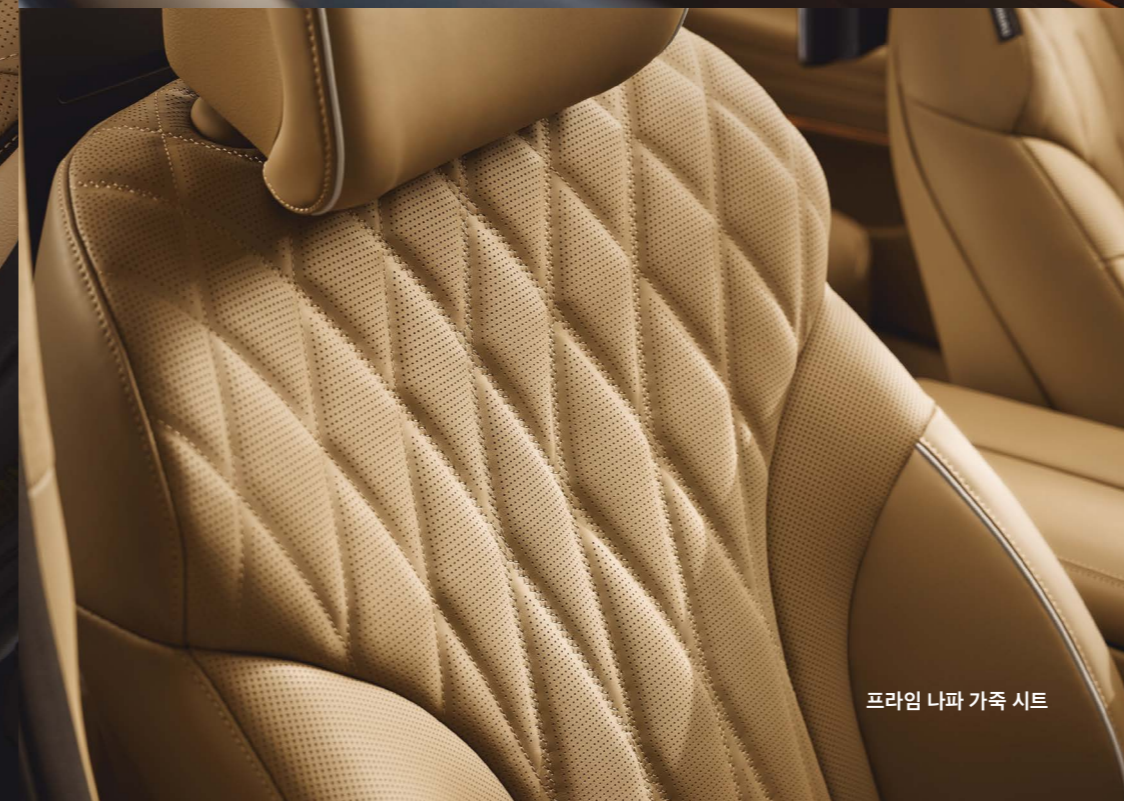
프라임 나파 가죽 시트