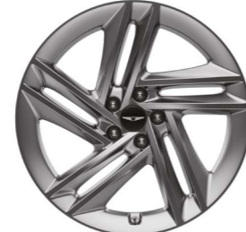
20인치 스퍼터링 휠