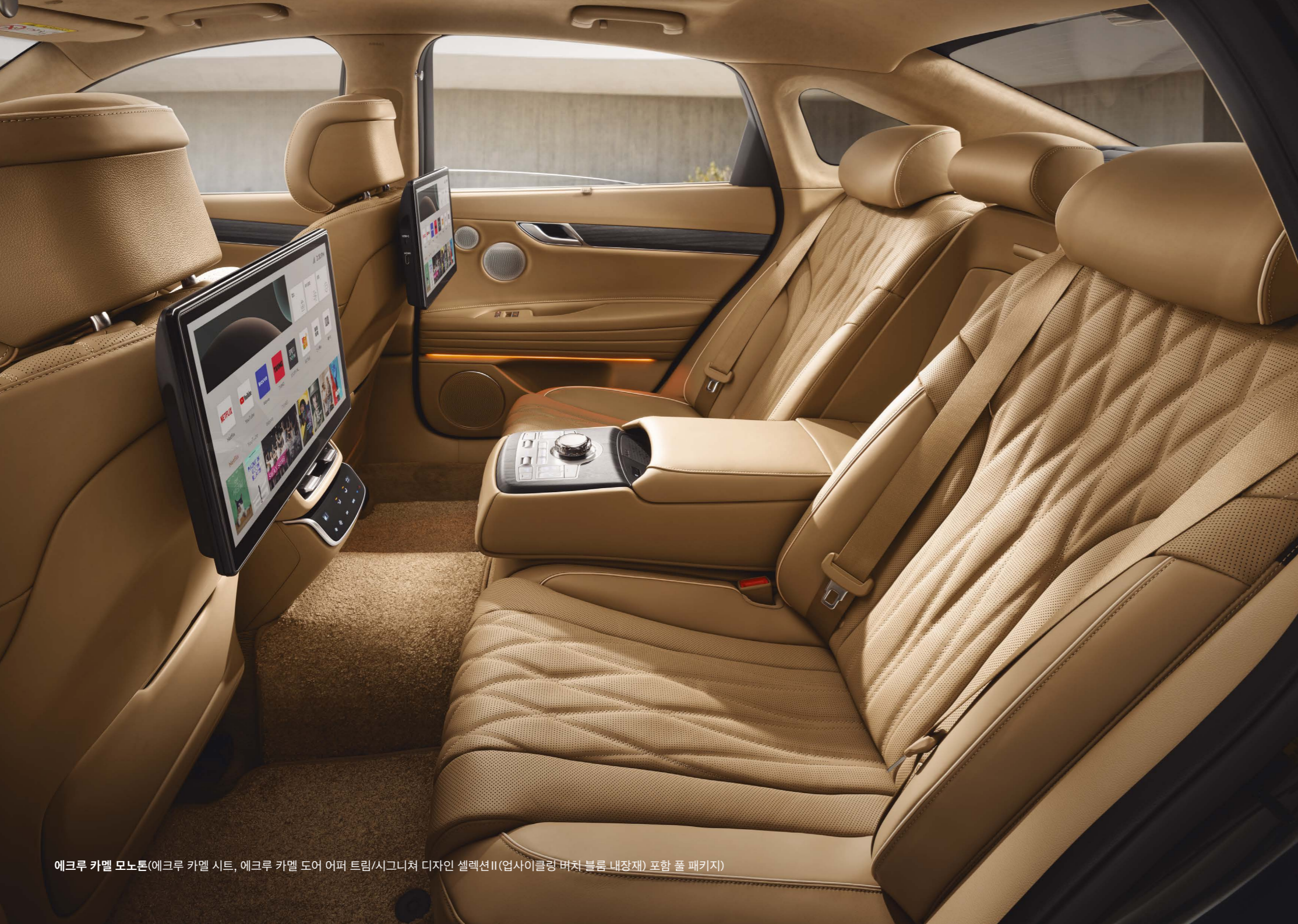
에크루 카멜 모노톤(에크루 카멜 시트, 에크루 카멜 도어 어퍼 트림/시그니처 디자인 셀렉션II(업사이클링 버치 블룸 내장재) 포함 풀 패키지)