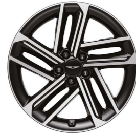
19인치 다이아몬드 커팅 휠(B)