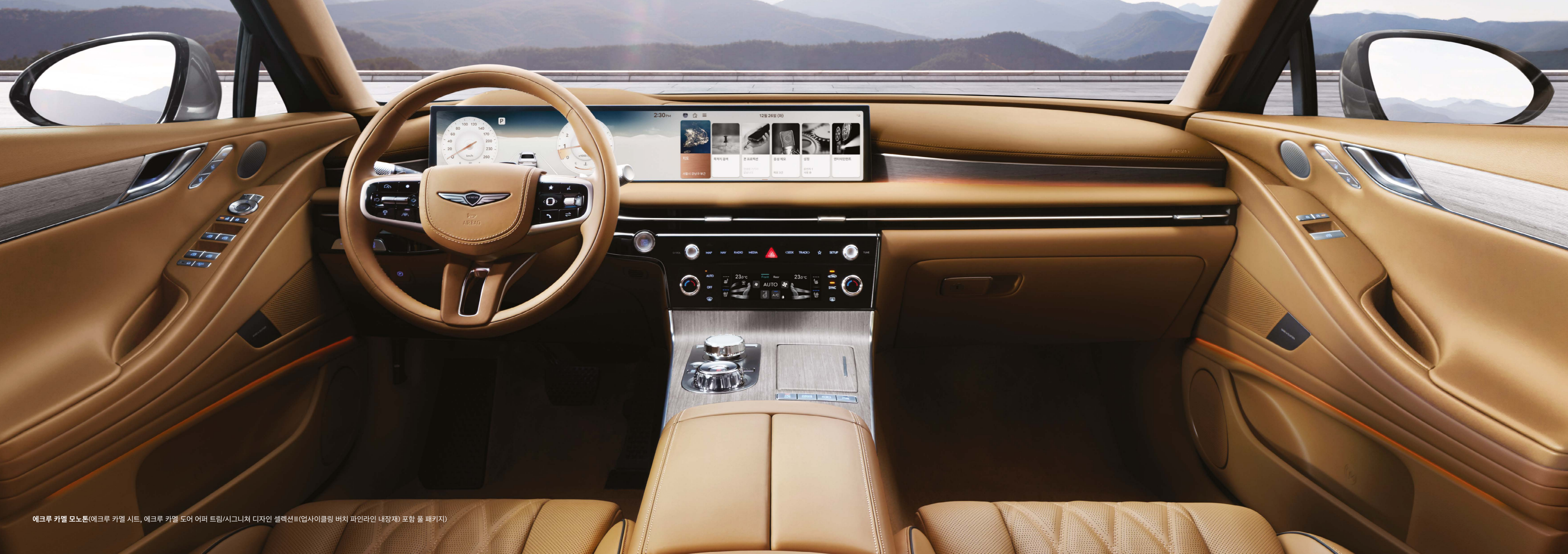
에크루 카멜 모노톤(에크루 카멜 시트, 에크루 카멜 도어 어퍼 트림/시그니처 디자인 셀렉션II(업사이클링 버치 파인라인 내장재) 포함 풀 패키지)