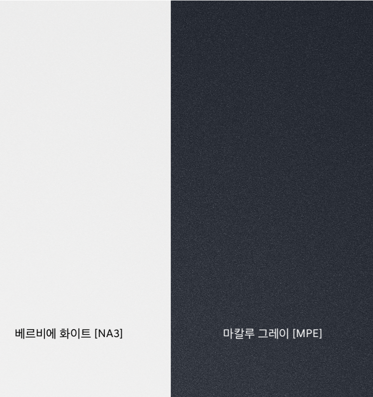
베르비에 화이트 [NA3]