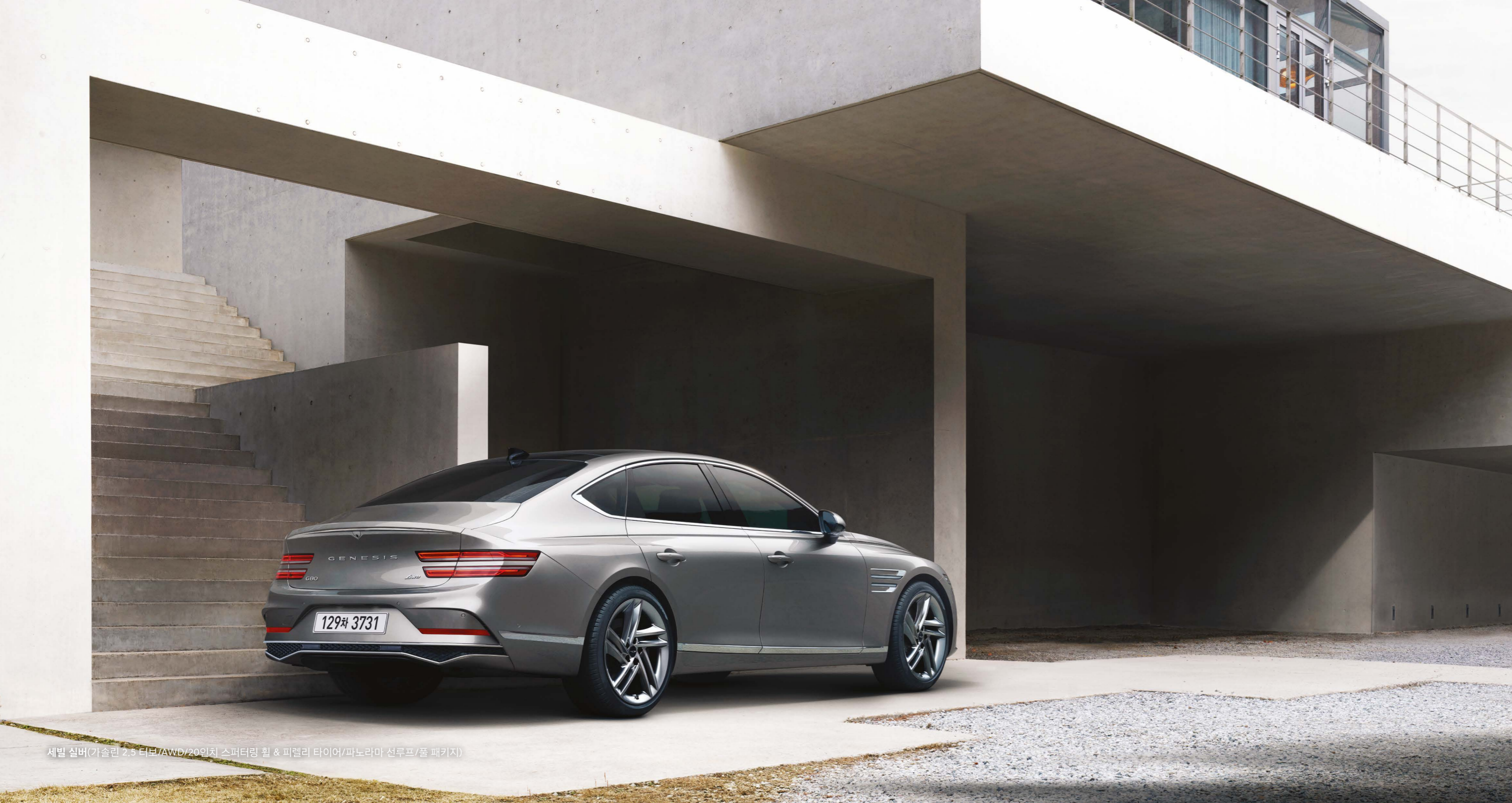
세빌 실버(가솔린 2.5 터보/AWD/20인치 스퍼터링 휠 & 피렐리 타이어/파노라마 선루프/풀 패키지)