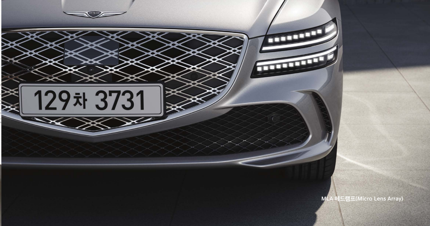
MLA 헤드램프(Micro Lens Array)