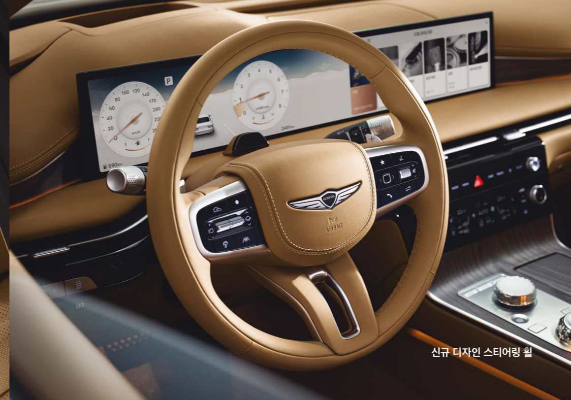
신규 디자인 스티어링 휠