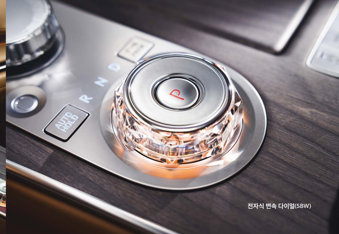
전자식 변속 다이얼(SBW)