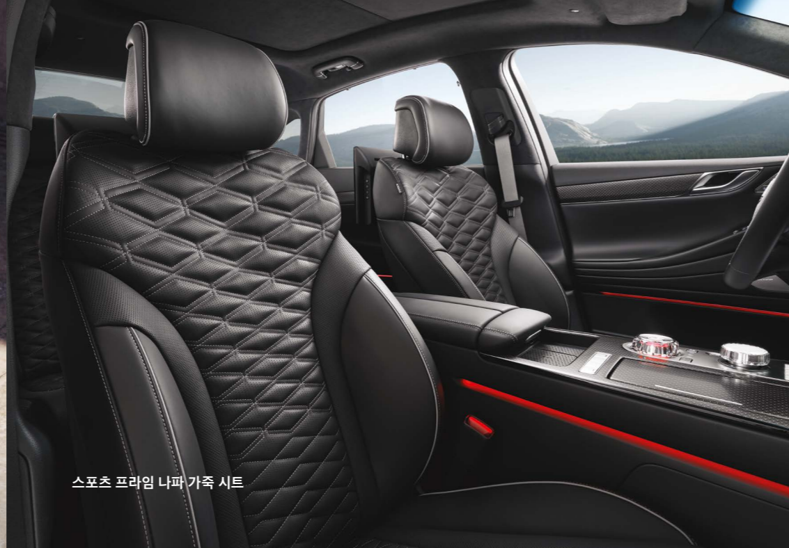
스포츠 프라임 나파 가죽 시트