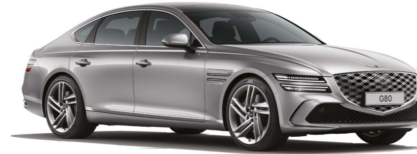
세빌 실버 (가솔린 2.5 터보/AWD/20인치 스포터링 휠/파노라마 선루프/폴 패키지)