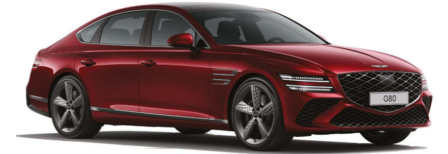
캐번디시 레드 (가솔린 3.5 터보/AWD/스포츠 패키지/20인치 다크 스포터링 휠/파노라마 선루프/폴 패키지)