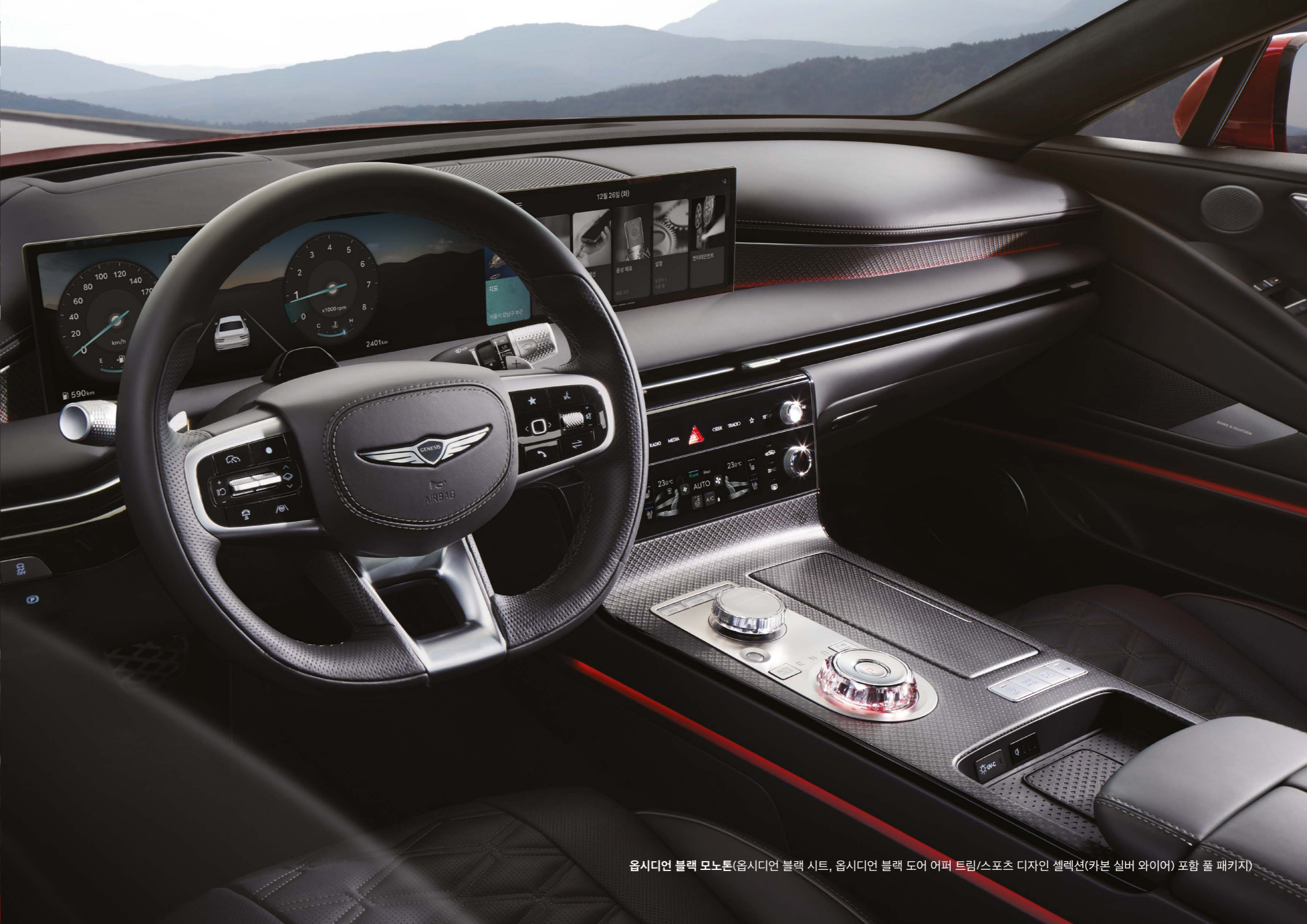
옵시디언 블랙 모노톤(옵시디언 블랙 시트, 옵시디언 블랙 도어 어퍼 트림/스포츠 디자인 셀렉션(카본 실버 와이어) 포함 풀 패키지)