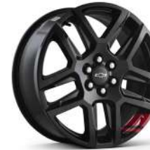
20인치 레드라인 시그니처 블랙 알로이 휠 (Redline 전용)