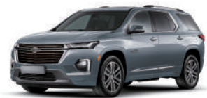
NEW 스틸링 그레이 (GXD)