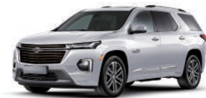
아발론 화이트 펄 (G1W)