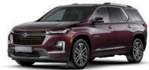
블랙 체리 (GLR)