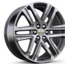
20인치 루나 그레이 머신드 알로이 휠 (High Country 전용)