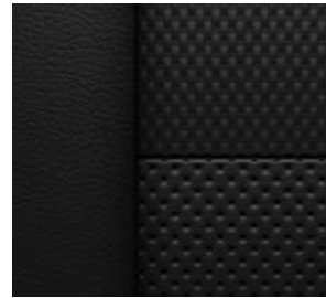
젯 블랙 & 레드 포인트 천연가죽 시트 (RS 전용)