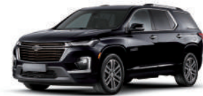
미드나이트 블랙 (GB8)