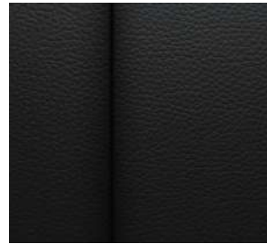
젯 블랙 천연가죽 시트 (LT Leather Premium 전용)