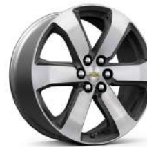
20인치 테크니컬 그레이 포켓 머신드 알로이 휠 (LT Leather Premium 전용)