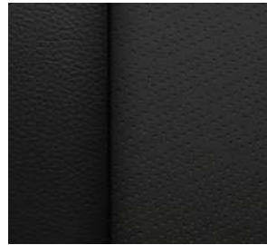
젯블랙 & 클로브 천공 천연가죽 시트 (High Country 전용)