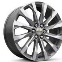
20인치 아전트 메탈릭 머신드 알로이 휠 (Premier 전용)