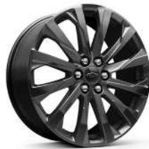
20인치 다크 안드로미드 페인티드 알로이 휠 (RS 전용)