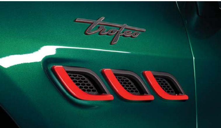
Quattroporte Trofeo - Side air vents and Trofeo Badge