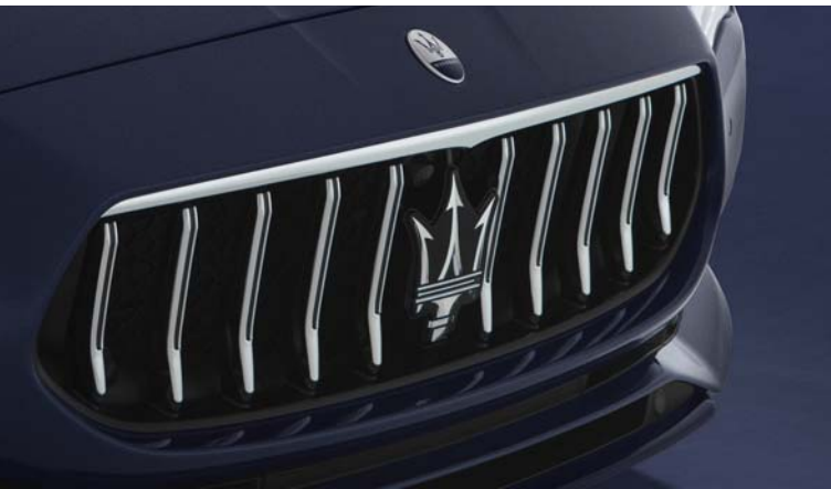
Quattroporte - Grille