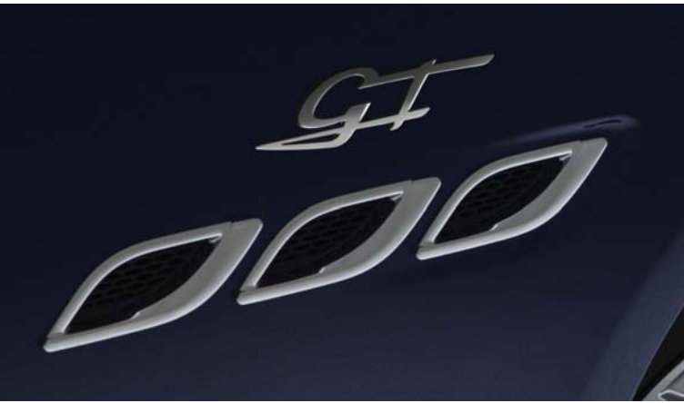
Quattroporte - Side air vents and GT Badge

콰트로포르테는 강렬한 고성능 파워와 하이-엔드 비즈니스 급 인텔리전스를 동시에 선보입니다. 레이싱 트랙을 달리는 슈퍼카의 성능을 선보이면서도, 놀랄 만큼 효율적이기 까지 합니다. 마세라티 콰트로포르테는 럭셔리, 스케일, 공간감과 경이로운 역동적 성능이 한데 어우러져 있습니다. 이 모든 것들이 역동적이면서도 강렬한 외관을 통해 완벽히 드러냅니다. 완벽하게 균형을 이룬 이상적인 무게 배분, 기본 적용된 스카이훅 서스펜션, 브렘보-듀얼 캐스트 브레이크까지, 콰트로포르테는 탁월한 역동성에 안락함과 안전성을 더했습니다.