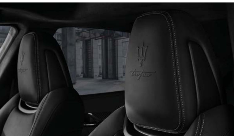
Quattroporte Trofeo - Headrest detail