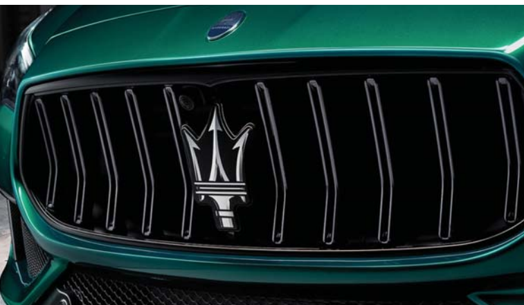
Quattroporte Trofeo - Grille