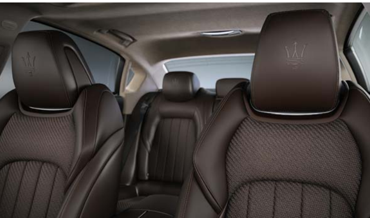
Quattroporte - Headrest detail