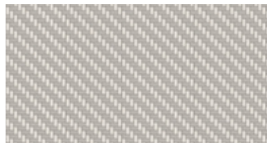
'Silver Rise Aluminium' (Prestige / Prestige 4Motion 적용)