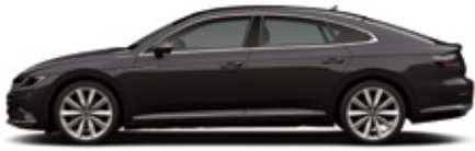
Manganese Gray Metallic