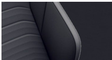
'Nappa' Leather Seat (Prestige / Prestige 4Motion 적용)