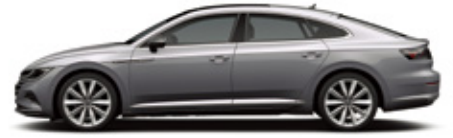
Pyrite Silver Metallic