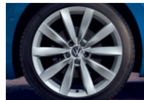
'Chennai' 8J x 19" alloy wheels 245/40 R19 tyres (Prestige 적용)