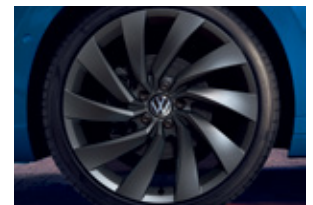
'Rosario' 8J x 20" alloy wheels 245/35 R20 tyres (Prestige 4Motion 적용)