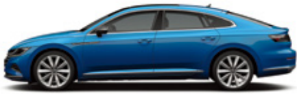
Kingfisher Blue Metallic (Prestige, Prestige 4Motion 전용)