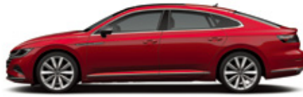
Kings Red Metallic