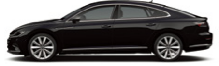
Deep Black Pearl Effect