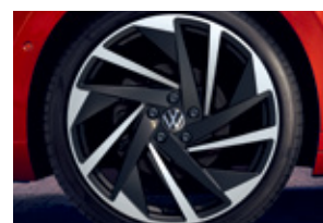
'Nashville' 8J x 20" alloy wheels 245/35 R20 tyres (R-Line 4Motion 적용)