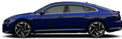
Lapis Blue Metallic (R-Line 4Motion 전용)