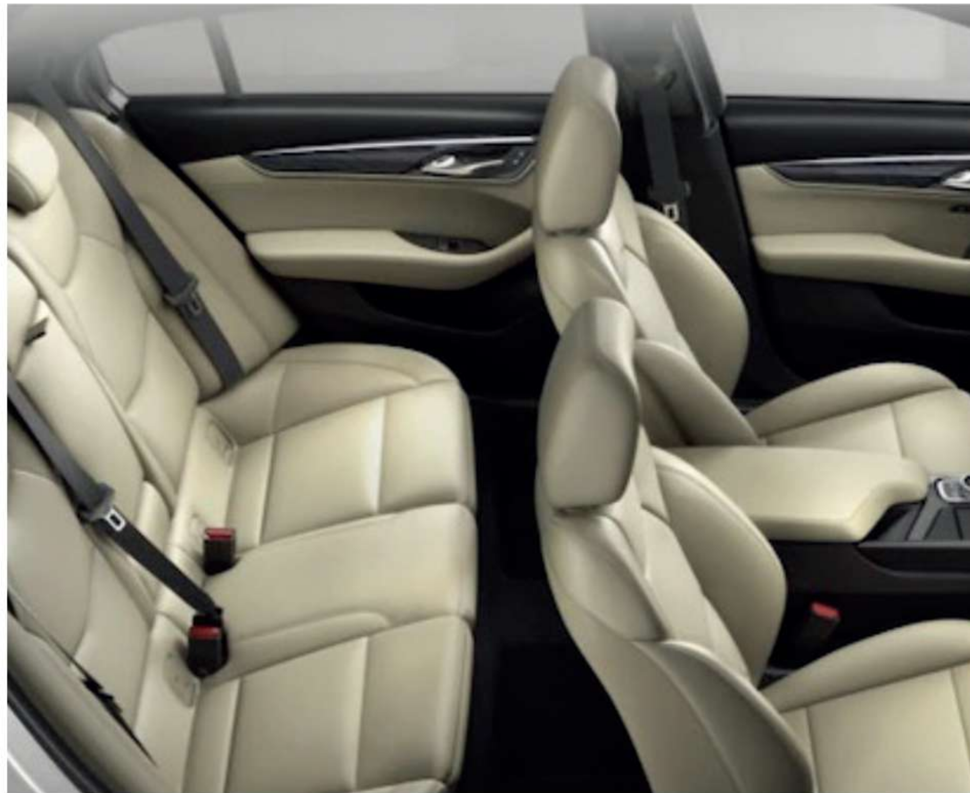
※ 상기 이미지는 실제 국내 적용 사양과 상이할 수 있습니다.

노이즈 캔슬링 시스템(Noise Cancelling System)은 실내에서 원치 않는 엔진 소음을 제거하는 데 도움을 줍니다. 엔진 사운드 인핸스먼트(Engine Sound Enhancement) 기능으로 엔진 사운드를 크거나 작게 조절할 수 있어, 더 짜릿한 드라이빙이 가능합니다.