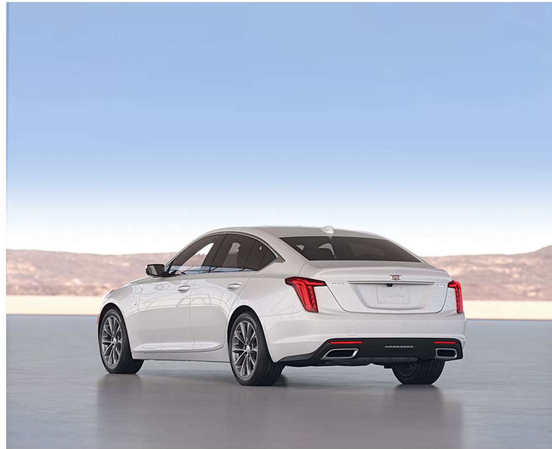
※ 상기 이미지는 실제 국내 적용 사양과 상이할 수 있습니다.

CT5의 액티브 퓨얼 매니지먼트 시스템은 정속 주행 등 특정 상황에서 실린더 일부를 비활성화하여 연료 소모를 줄여 줍니다.