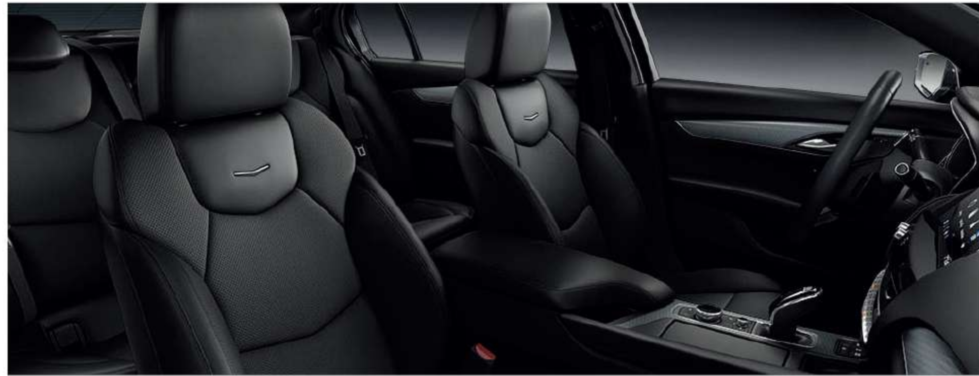
Leather Seating Surfaces with Mini-Perforated inserts JET BLACK WITH JET BLACK ACCENTS With Brushed Aluminum trim