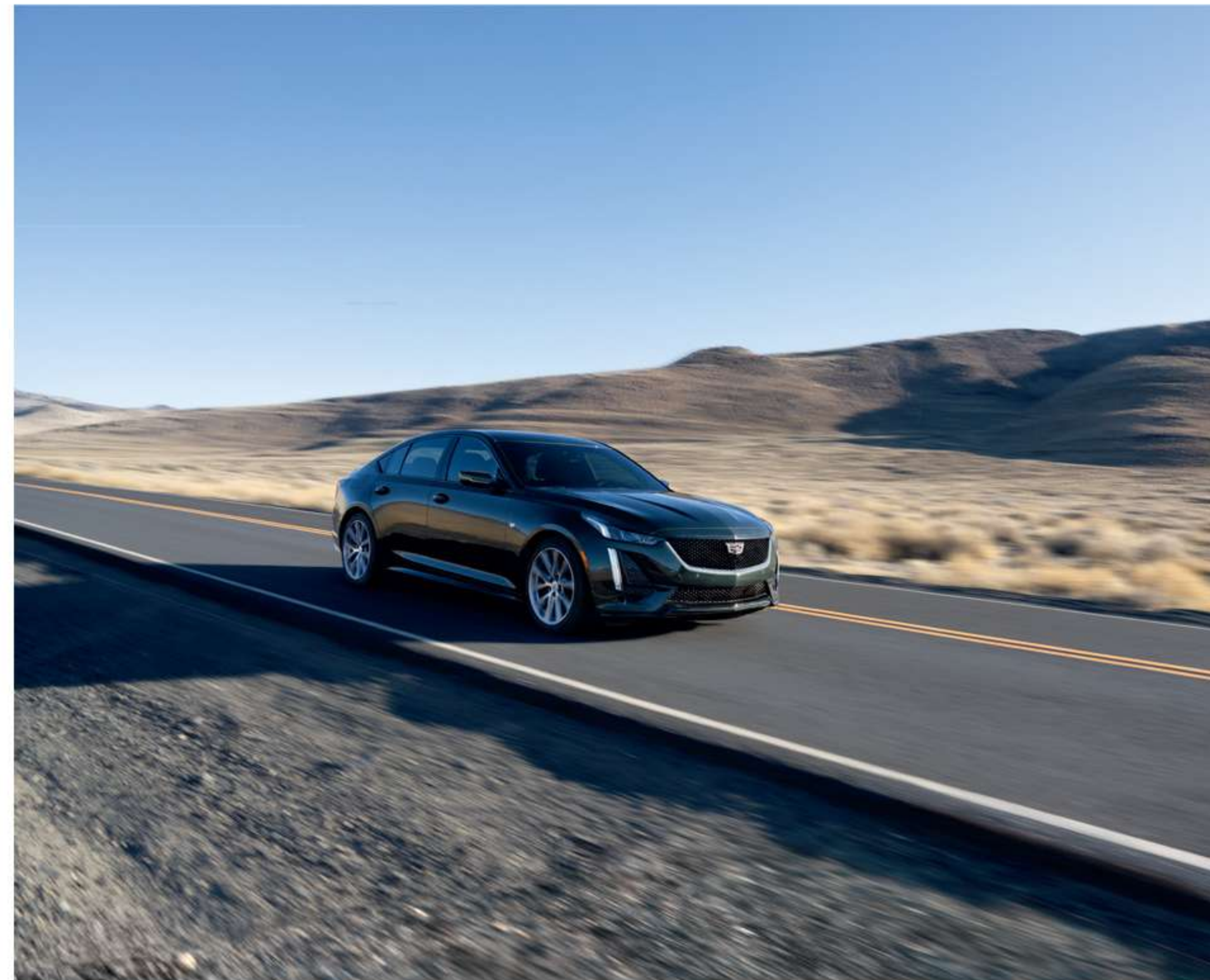
※ 상기 이미지는 실제 국내 적용 사양과 상이할 수 있습니다.

투어(Tour), 스포츠(Sport), 스노우/아이스(Snow/Ice), 마이 모드(My Mode)와 같은 드라이브 모드 선택을 통해 각 도로에 최적화된 주행이 가능합니다.