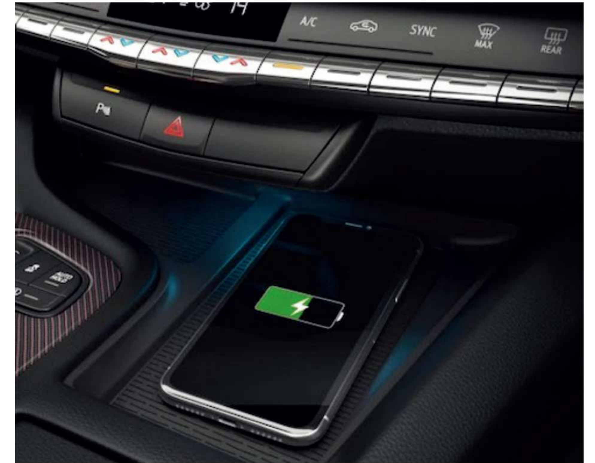
※ 상기 이미지는 실제 국내 적용 사양과 상이할 수 있습니다.

스마트폰을 충전 패드 위에 올려놓기만 해도 자동으로 무선 충전 2) 이 가능합니다. 또한 애플 카플레이™ 및 안드로이드 오토와 무선으로 호환되어, 10인치 터치스크린을 통해 스마트폰의 메시지, 음악, 지도 등에 액세스할 수 있습니다.