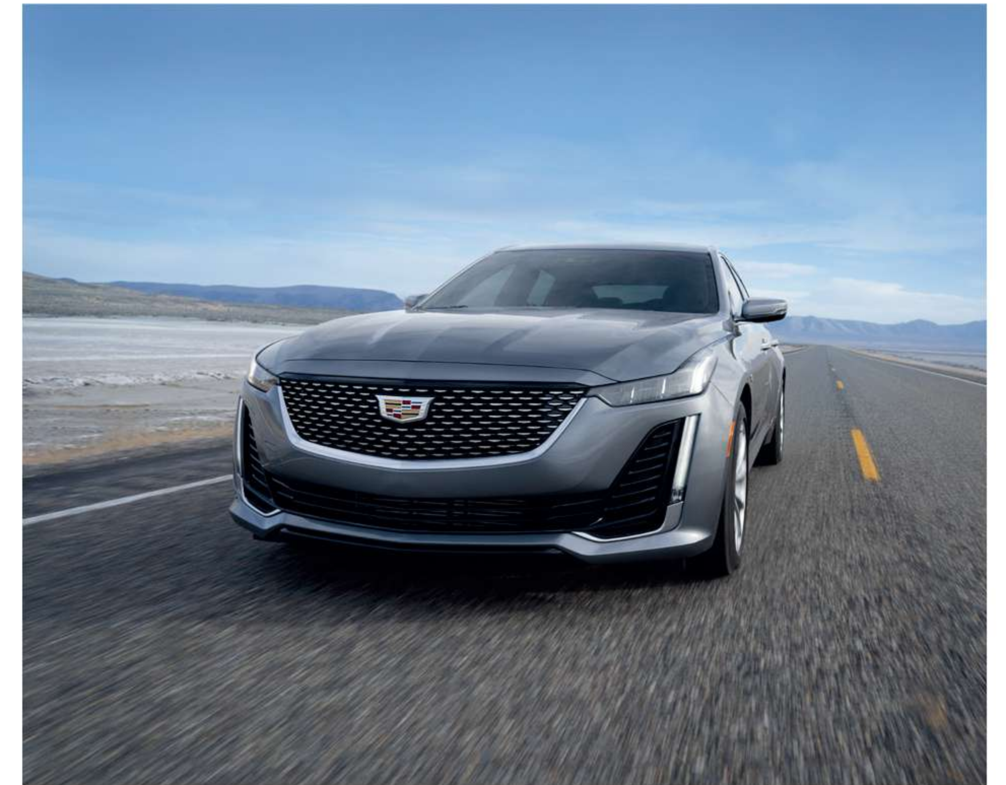
※ 상기 이미지는 실제 국내 적용 사양과 상이할 수 있습니다.

CT5의 서스펜션은 탁월한 핸들링과 편안함을 동시에 고려하여, 향상된 승차감을 제공하도록 설계되어 있습니다. 또한 전자식 파워 스티어링으로 정밀한 조향이 가능합니다.