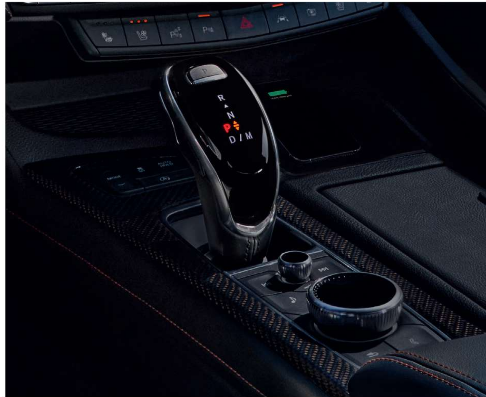
※ 상기 이미지는 실제 국내 적용 사양과 상이할 수 있습니다.

동급 최고 수준의 첨단 10단 자동 변속으로 출력을 제어하며, 보다 섬세한 엔진 작동을 통해 향상된 주행성능과 연비를 실현합니다.