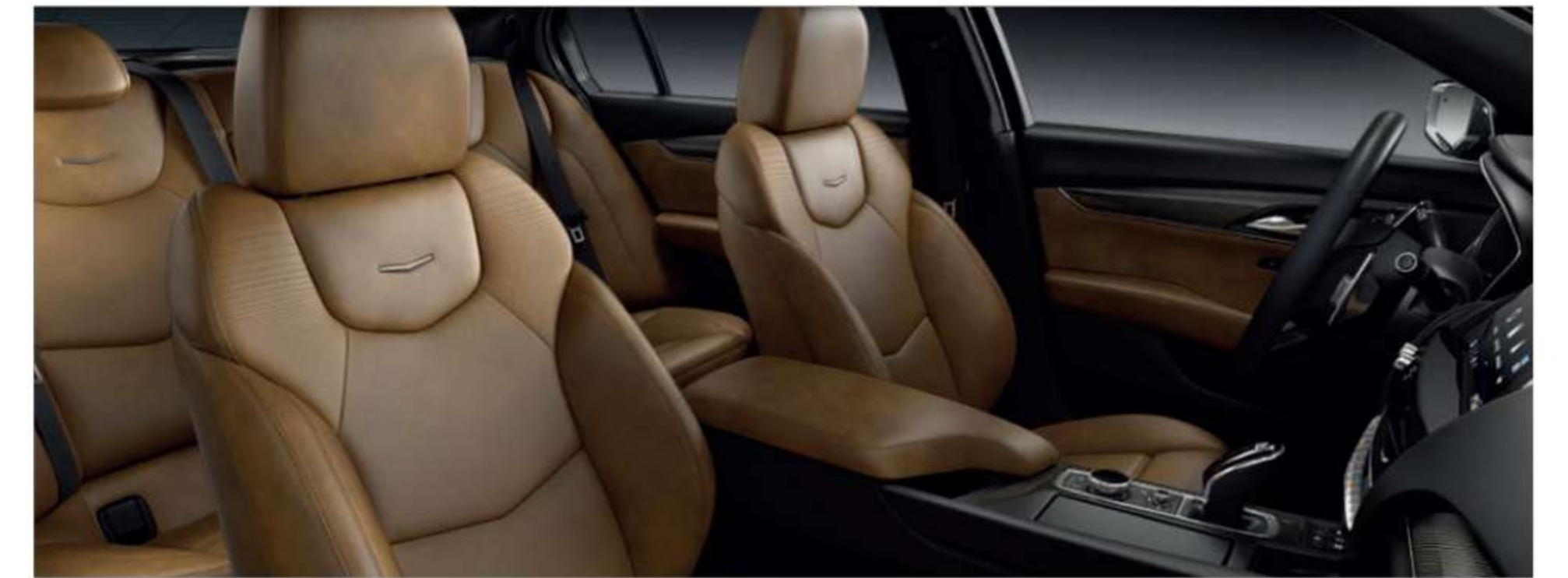
Semi-Aniline Leather Seats with Chevron Perforated inserts SEDONA SAUVAGE WITH JET BLACK ACCENTS With Twenty-Two Carbon Fiber trim