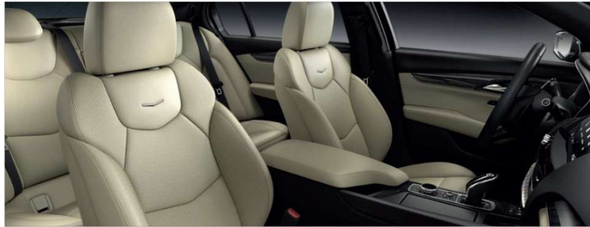
Leather Seating Surfaces with Mini-Perforated inserts SAHARA BEIGE WITH JET BLACK ACCENTS With Misty Matrix Wood trim