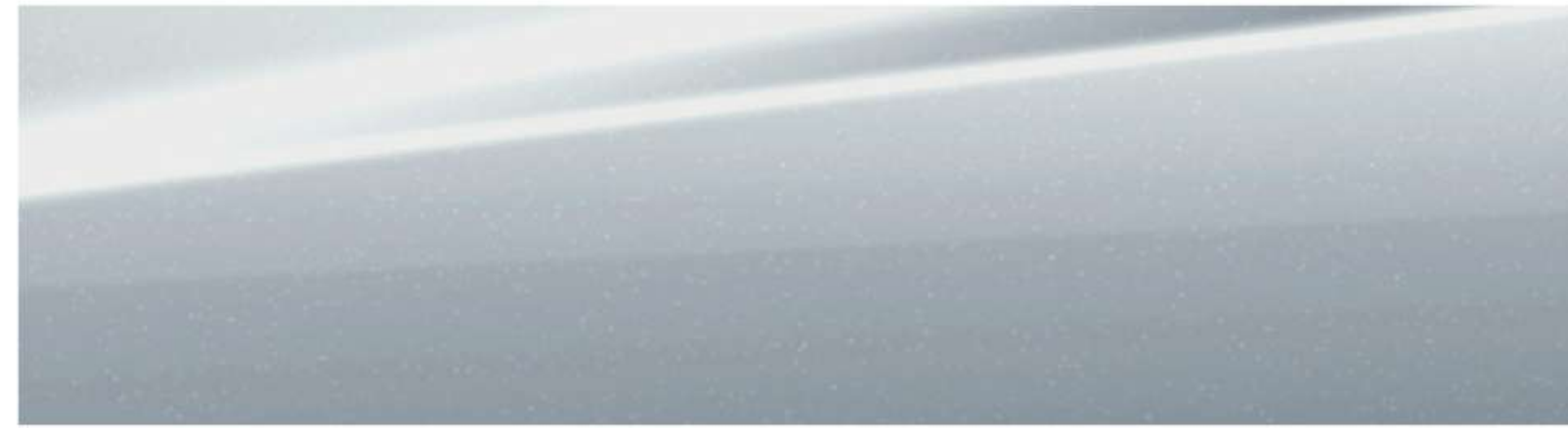
SATIN STEEL METALLIC