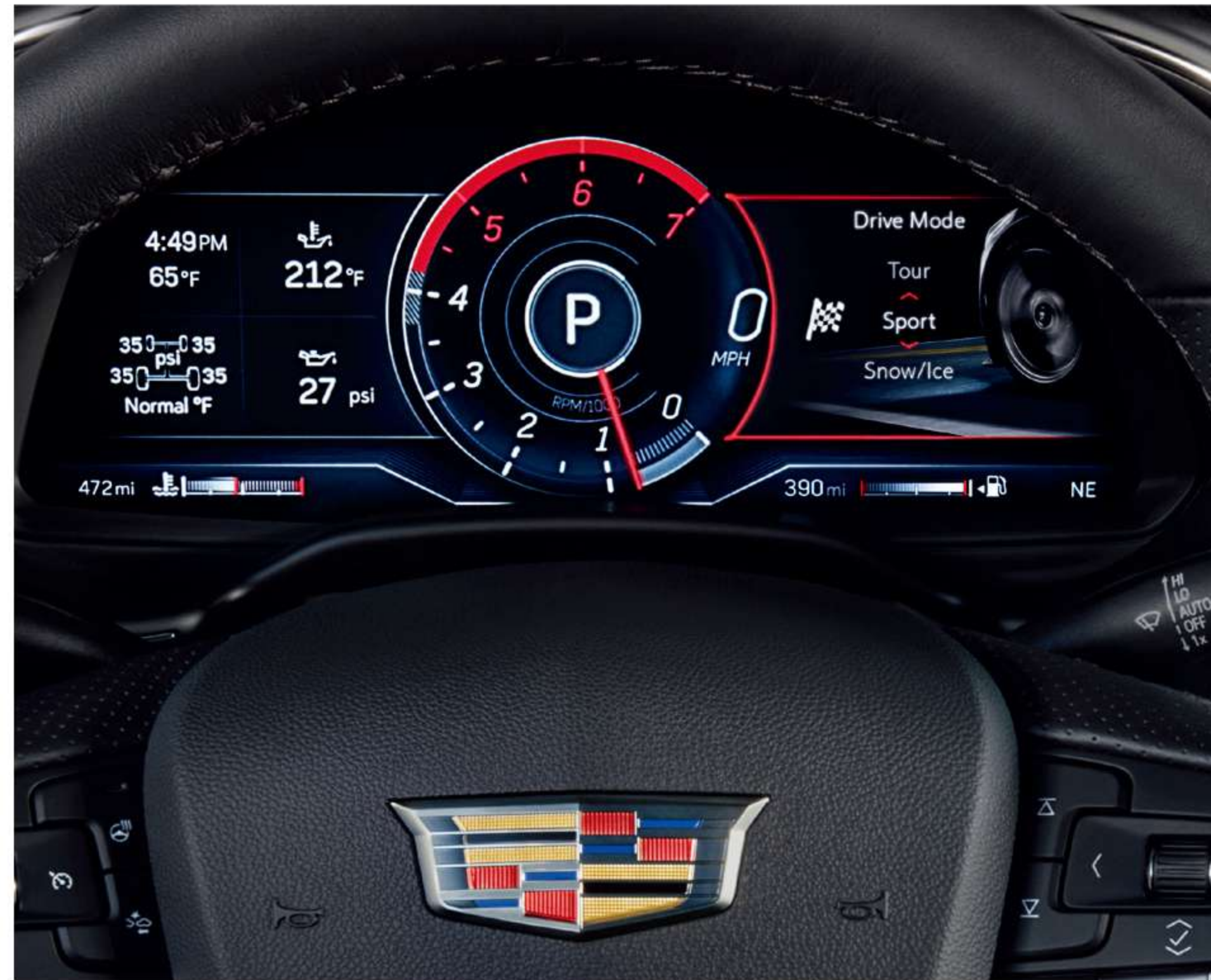
※ 상기 이미지는 실제 국내 적용 사양과 상이할 수 있습니다.

10인치 CUE 인포테인먼트 디스플레이, 로터리 인포테인먼트 컨트롤러, 새로 적용된 12인치 HD 컬러 디지털 드라이버 클러스터까지. 캐딜락 유저 익스피리언스(CUE) 시스템을 통해 터치 혹은 음성 명령으로 다양한 인포테인먼트 기능을 사용할 수 있습니다.