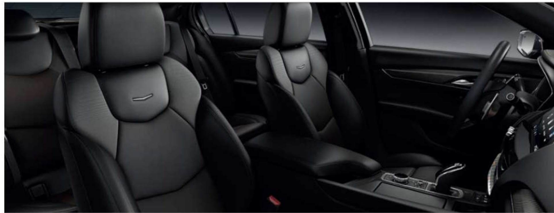
Leather Seating Surfaces with Mini-Perforated inserts JET BLACK WITH JET BLACK ACCENTS With Twenty-Two Carbon Fiber trim