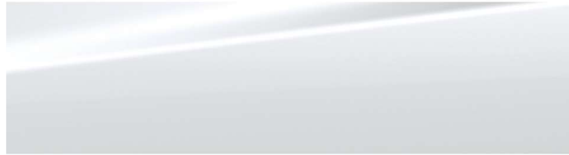
CRYSTAL WHITE TRICOAT