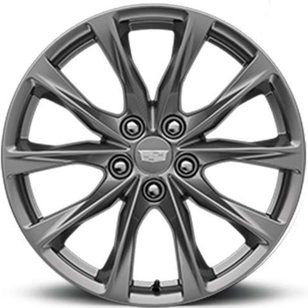
19" PREMIUM PAINTED ALLOY WITH PEARL NICKEL FINISH