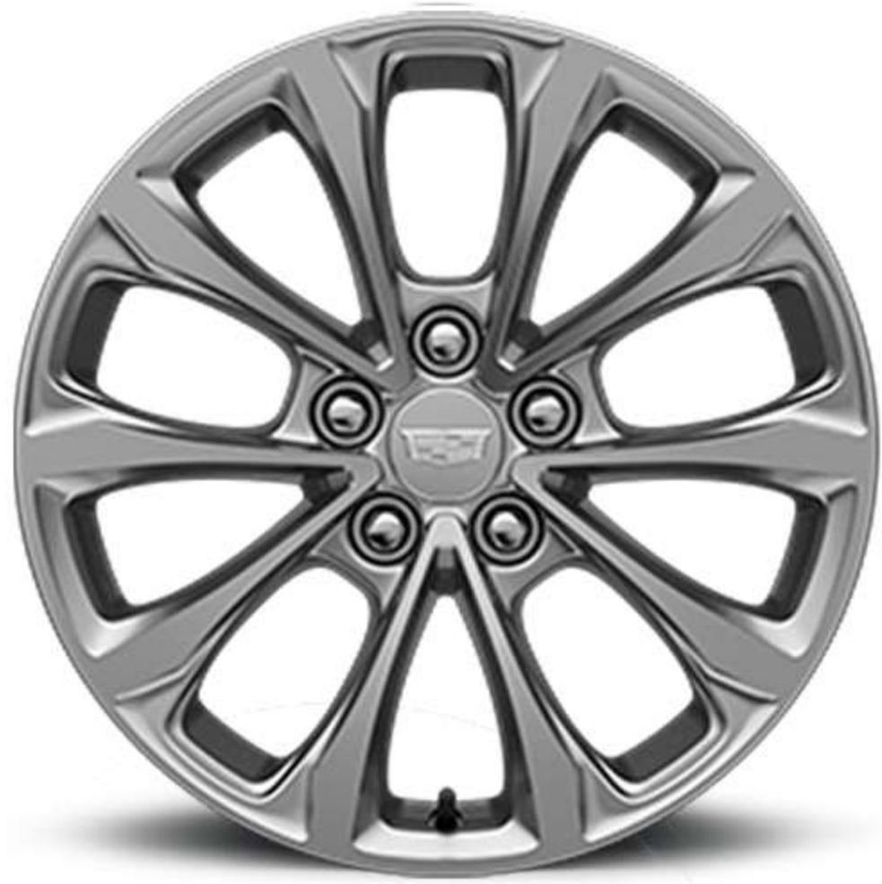
18" PREMIUM PAINTED ALLOY WITH MANOOGIAN SILVER FINISH