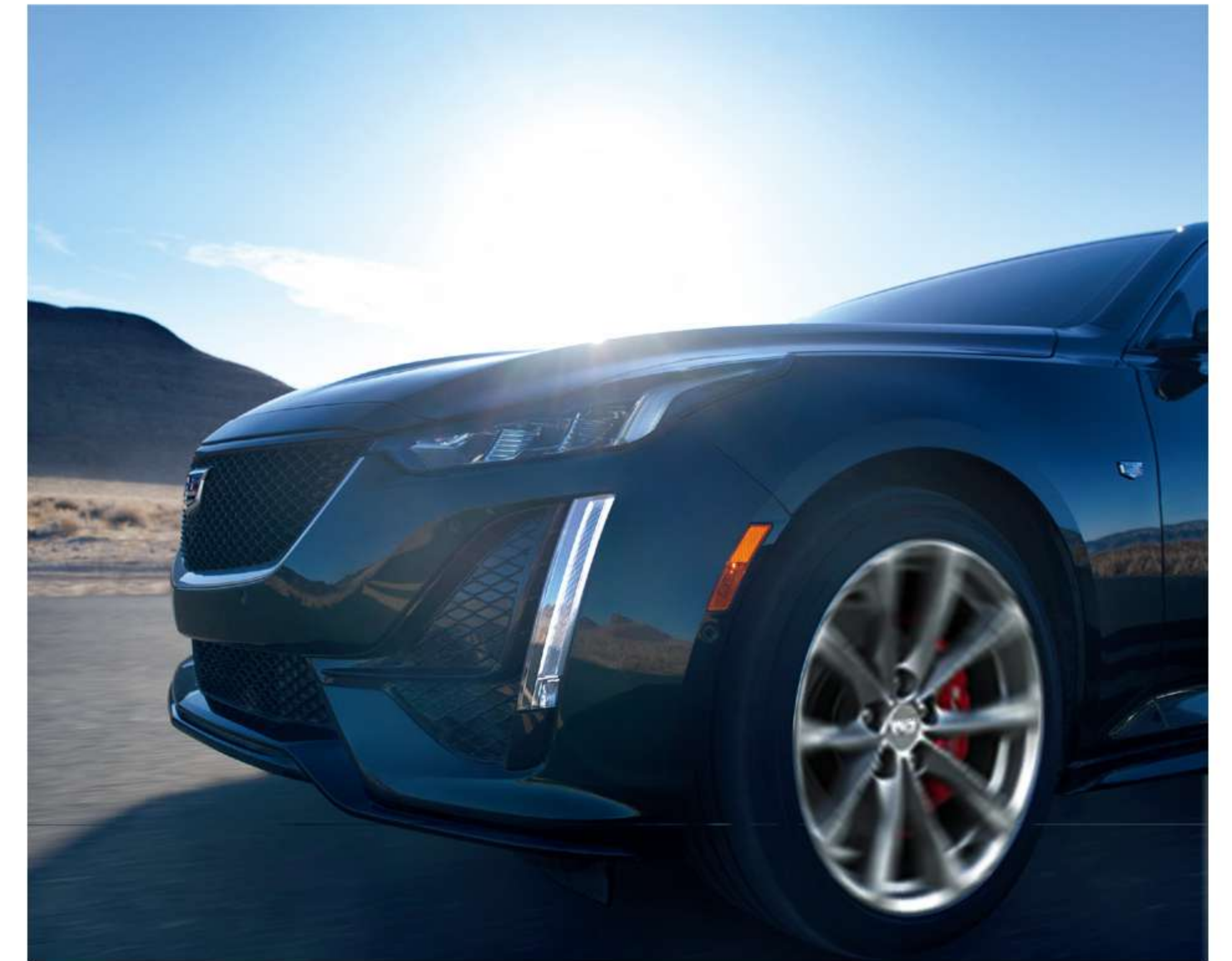
※ 상기 이미지는 실제 국내 적용 사양과 상이할 수 있습니다.

누가 운전하든, 어떤 도로에서든 완벽한 성능과 제어력. 마그네틱 라이드 컨트롤 1) 은 노면을 1/1,000초 단위로 스캔해 스스로 댐핑력을 조절함으로써 최적화된 고속 안정성을 제공합니다.