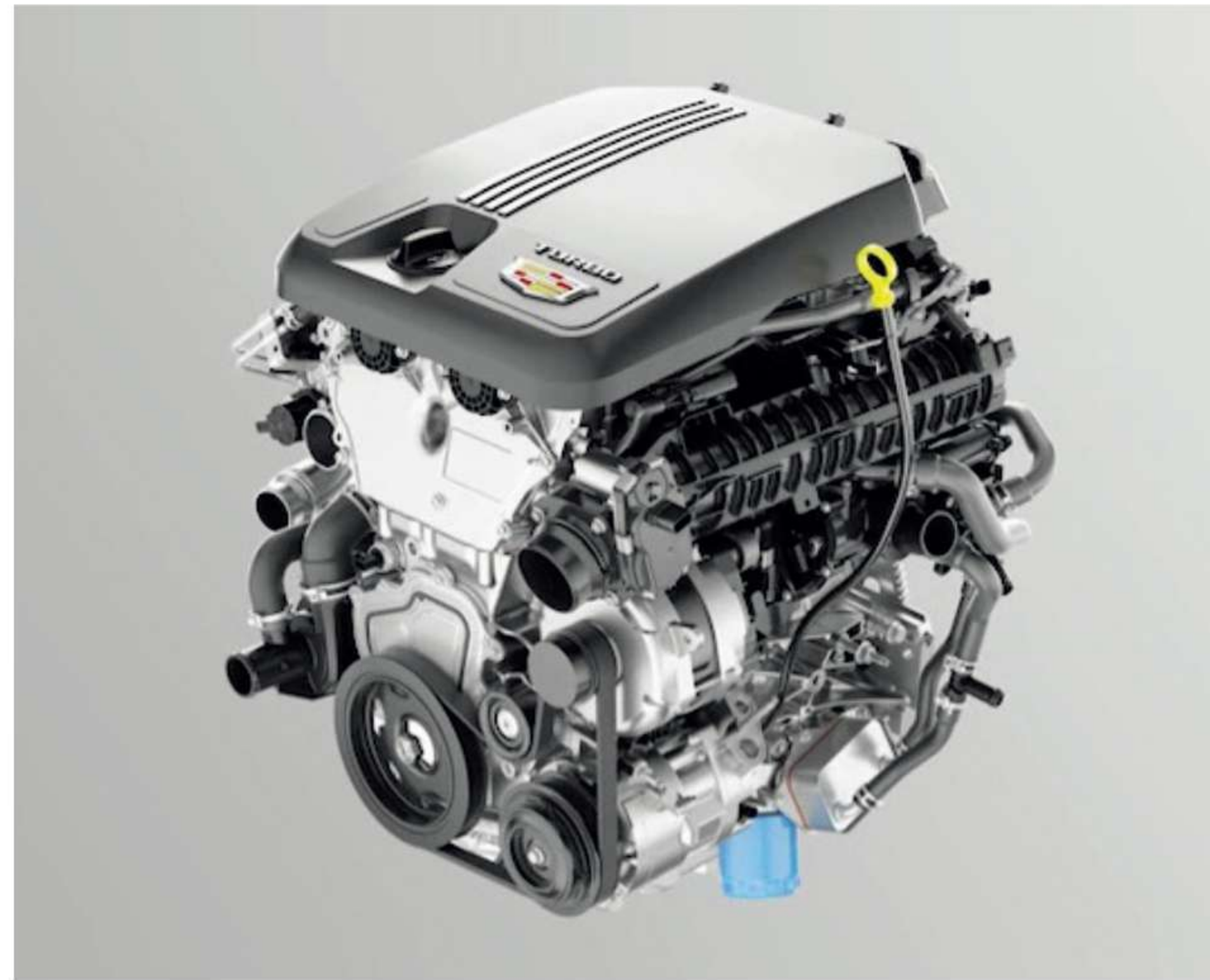
※ 상기 이미지는 실제 국내 적용 사양과 상이할 수 있습니다.

CT5는 2.0L 트윈 스크롤 터보 차지 엔진으로 빠르게 최대출력에 도달할 수 있으며, 최고출력 240마력, 최대토크 35.7kg·m의 성능을 발휘합니다.