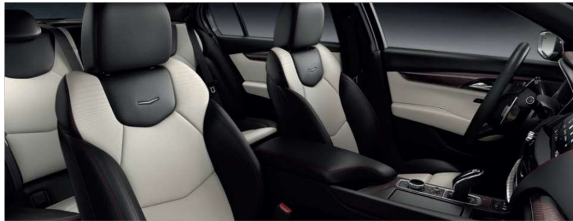
Leather Seating Surfaces with Mini-Perforated inserts WHISPER BEIGE WITH JET BLACK ACCENTS Morello Carbon Fiber trim