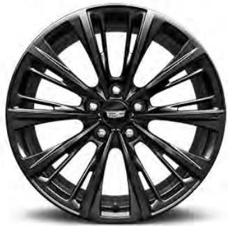
19" ALUMINUM ALLOY WHEELS WITH SATIN GRAPHITE DARK FINISH