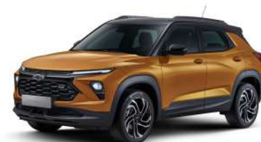
NEW 토피넛 브라운 (G98)