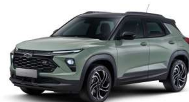
NEW 피스타치오 카키 (GVR)