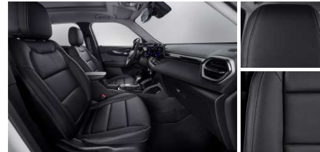
젯 블랙 & 빅토리아 헤링본 포인트 인테리어 (LT & Premier)