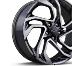
19인치 RS 카본 플래시 머신드 알로이 휠 (RS 전용)