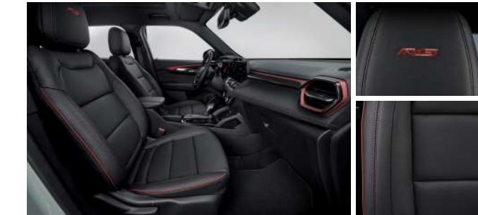
젯 블랙 & 레드 포인트 인테리어 (RS)

※ 상기 이미지는 컴포트 패키지 선택 시 천공 천연 가죽시트가 적용된 이미지임 (LT & Premier)