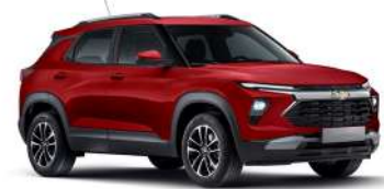
밀라노 레드 (GFM)