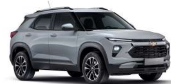
스털링 그레이 (GZB)