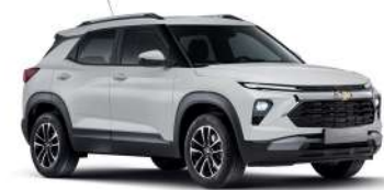
스노우 화이트 펄 (GP5)