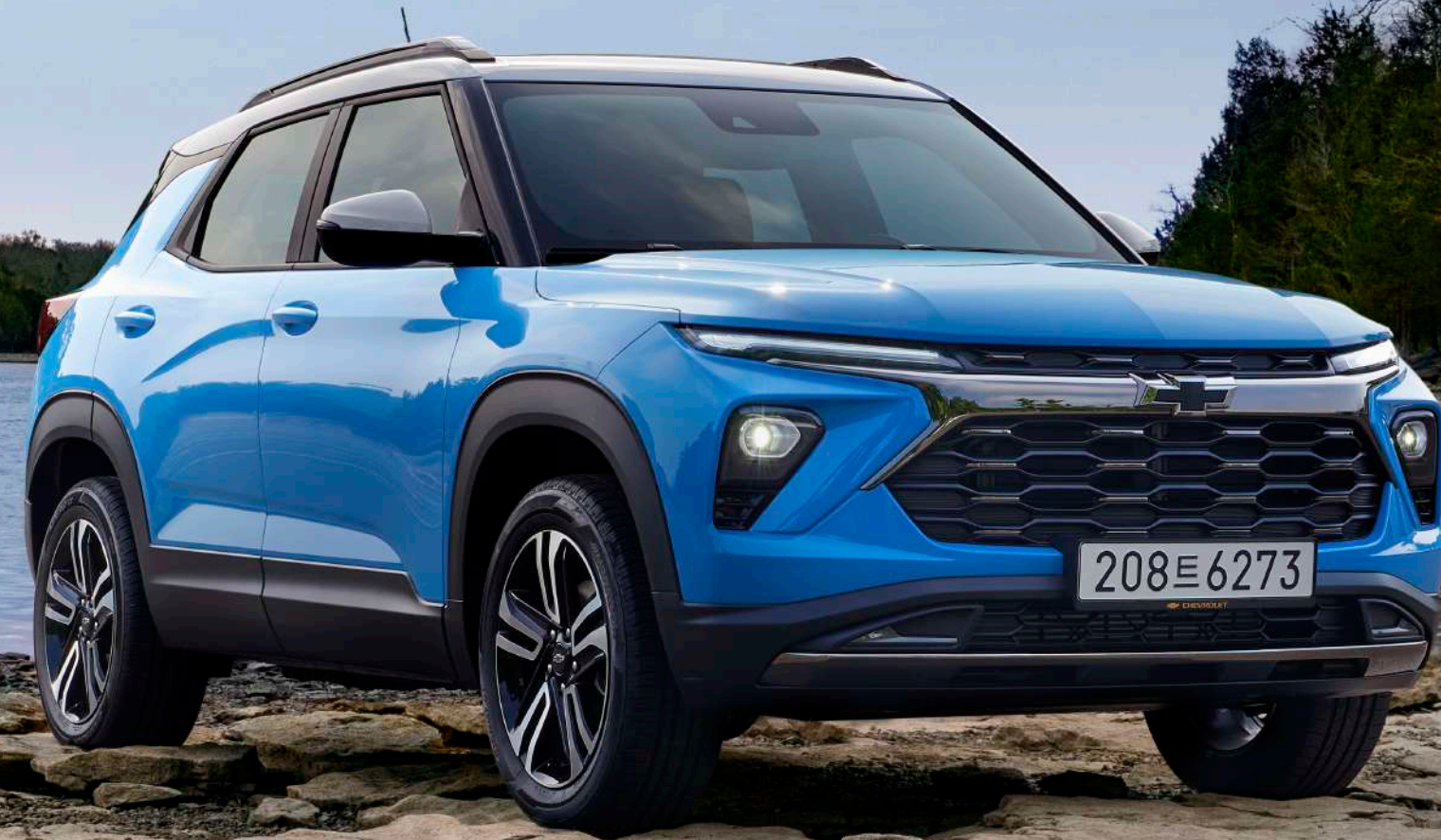
더 뉴 트레일블레이저 ACTIV 새비지 블루