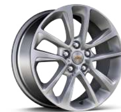
17인치 실버 알로이 휠 (LT 전용)