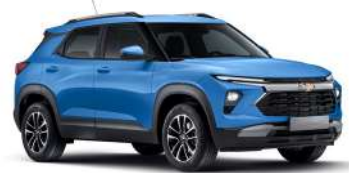
새비지 블루 (GLN)