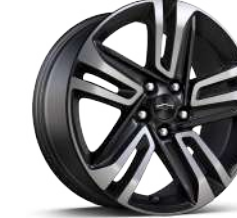
18인치 ACTIV 머신드 알로이 휠 (ACTIV 전용)