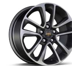
17인치 머신드 알로이 휠 (Premier 전용)