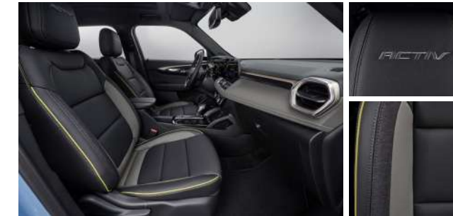
젯 블랙 & 아르테미스 포인트 인테리어 (ACTIV)