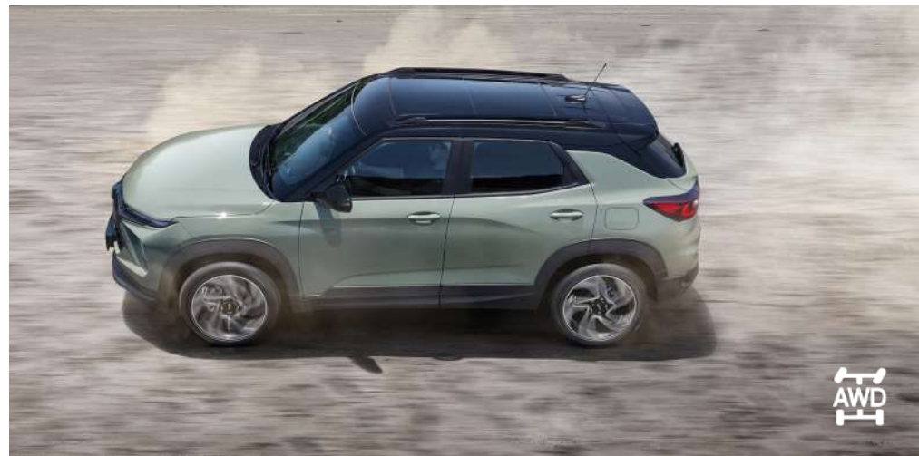
드라이브 모드 (스포츠/스노우) 스위처블 AWD 시스템