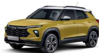
NEW 어반 옐로우 (GHS)