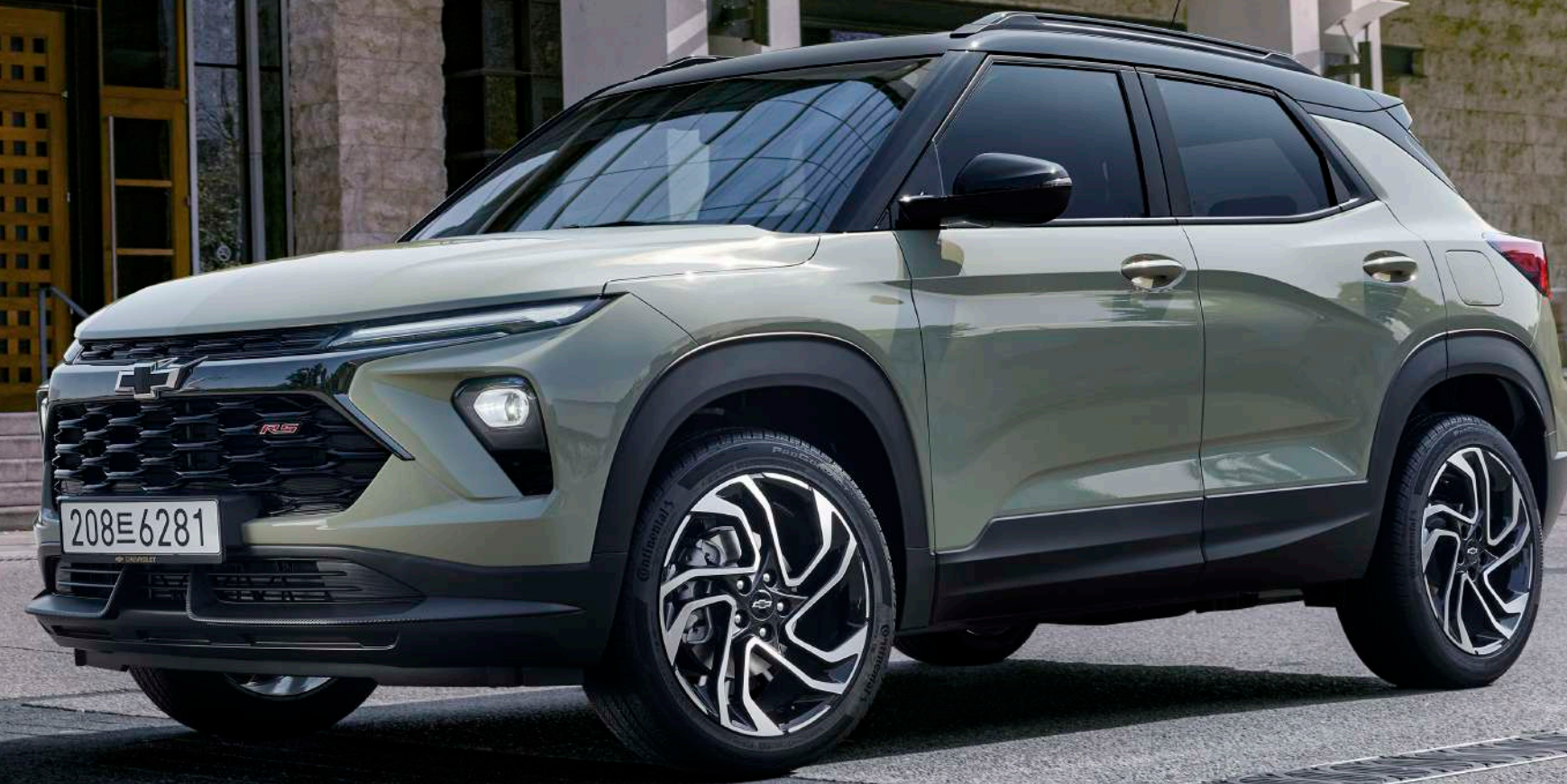
더 뉴 트레일블레이저 RS 피스타치오 카키