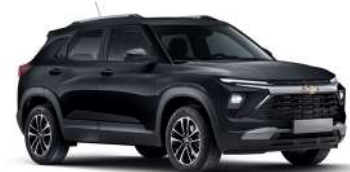
모던 블랙 (GB0)