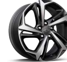
18인치 RS 머신드 알로이 휠 (RS 전용)