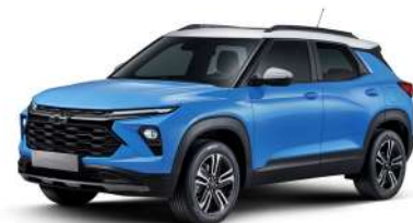
새비지 블루 (GLN)