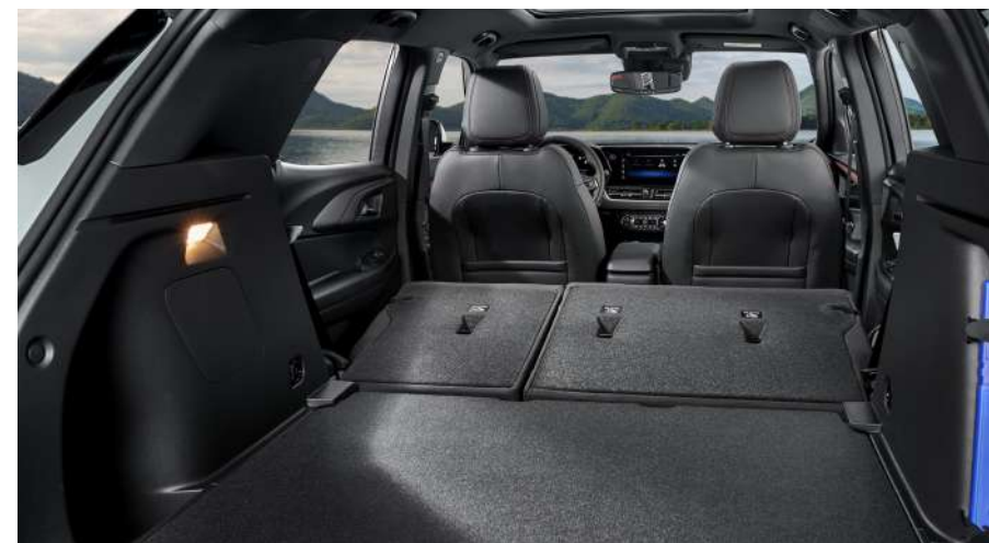
보타이 프로젝션 핸즈프리 파워 리프트게이트 파노라마 선루프 2열 플랫 폴딩