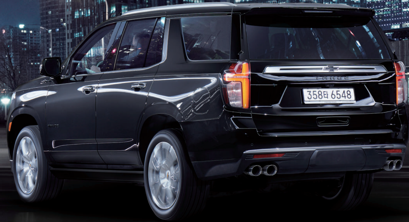
하이컨트리 로고 쿼드 머플러 팁