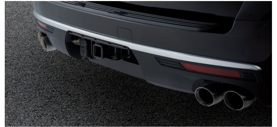
트레일러 히치 리시버 및 커넥터 히치 뷰 모니터링

히치뷰 카메라 기능과 트레일러 어시스트 가이드라인, 견인봉 감지 보상 기능을 통해 트레일러를 더욱 손쉽게 연결하실 수 있으며 차체 자세 제어 시스템 적용으로 트레일러 견인 시 스웨이를 효율적으로 제어해 더욱 편리하고 업그레이드된 라이프스타일을 경험하실 수 있습니다.