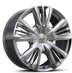
22인치 크롬 실버 프리미엄 페인티드 휠