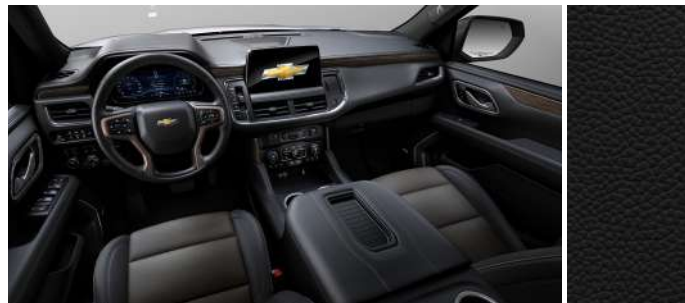
젯 블랙 천공 천연 가죽시트