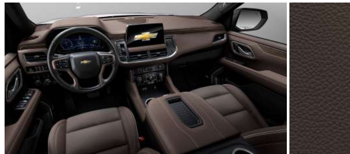
모카 브라운 천공 천연 가죽시트