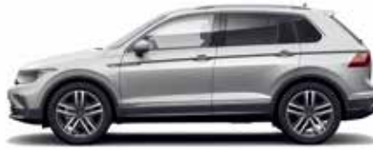
Reflex Silver Metallic