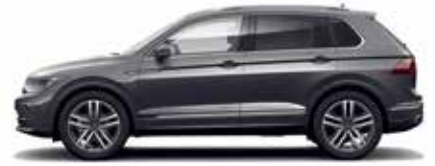
Dolphin Gray Metallic