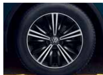
'Nizza' 7J x 18" alloy wheels 235/55 R18 tyres (Premium / Premium 4Motion 적용)