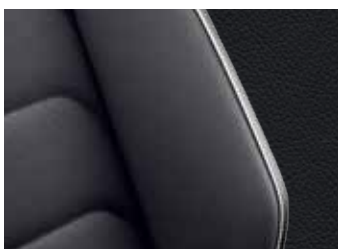
'Vienna' Leather Seat Titan Black