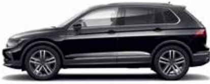
Deep Black Pearl Effect