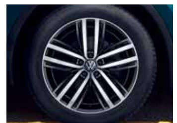
'Auckland' 7J x 19" alloy wheels 235/50 R19 tyres (Prestige / Prestige 4Motion 적용)