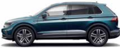
Nightshade Blue Metallic