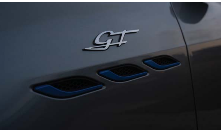
Ghibli GT Hybrid - Side air vents and GT Badge

세상은 단 하나의 불꽃이 새로운 무언가로 진화하는 순간들로 가득합니다. 바로 혼합이 변화의 기폭제가 되는 순간이지요. 바로 이 점에 영감을 받아 마세라티 기블리 GT 하이브리드가 탄생되었습니다. 신형 기블리 라인업 최초로 선보이는 마세라티를 위한 새로운 시대의 선봉. 기블리 GT 하이브리드는 마세라티의 과거를 계승하는 동시에 새로운 미래를 점화해나갑니다. 마세라티 역사상 최초의 하이브리드 엔진, 혁신과 기술로 완성된 고성능 자동차 엔지니어링과의 결합은 마세라티의 지속 가능한 미래로의 도약을 지원할 것입니다. 디젤 보다 빠르고, 가솔린 보다 청정하게. 이것이 바로 기블리 GT 하이브리드의 철학입니다.