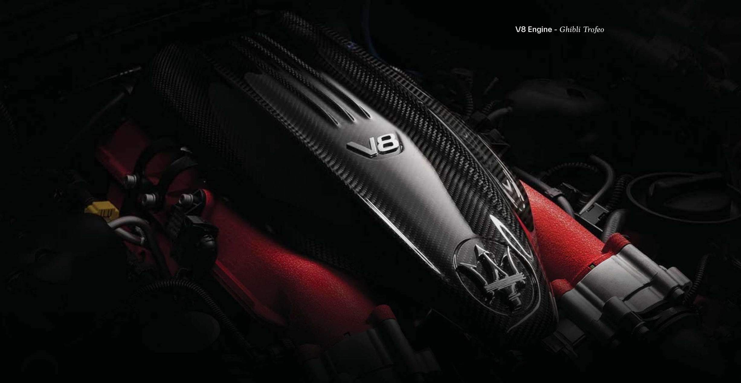
V8 Engine - Ghibli Trofeo