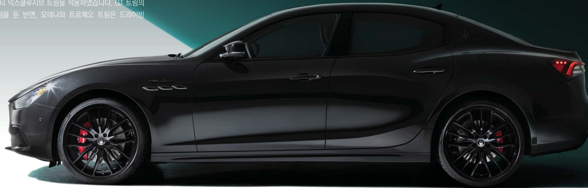
Ghibli - Side air vents and Modena Badge

기블리는 럭셔리 스포츠 세단에 기대하는 안락함을 선사합니다. 또한 그 반면에 레이저처럼 날렵한 스포츠 카의 핸들링으로 자신을 차별화합니다. 마세라티의 시그니처이기도 한 이 제품의 캐릭터는 여러분이 사무실로 향하는 길이든, 또는 신나는 드라이브를 떠나는 길이든 어떤 상황에서도 끝없는 영감의 원천이 되어 줍니다. 기블리는 GT, 모데나, 트로페오 등 세가지 새로운 마세라티 익스클루시브 트림을 적용하였습니다. GT 트림의 경우, 고급스러움과 안락함에 역점을 둔 반면, 모데나와 트로페오 트림은 드라이빙 역동성에 중점을 두었습니다.