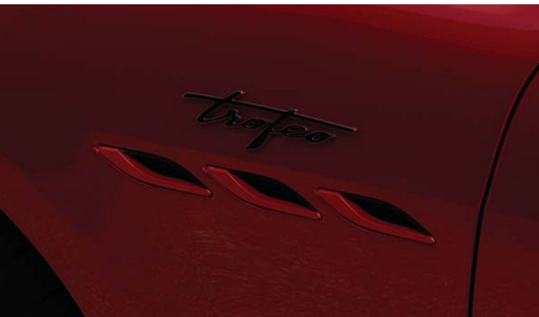
Ghibli Trofeo - Side air vents and Trofeo Badge

담대하라. 취향을 표현하라. 마세라티 기블리 트로페오는 단 4.3 초 만에 앞으로 치고 나갑니다. 최고 출력 580 hp과 최고 속도 326 km/h, 트로페오는 지금껏 가장 파워풀한 기블리입니다. 가능성의 예술을 재정의한 대담한 위용, 레이스에 영감을 받은 디자인 요소들로 강화된 기블리의 강렬한 쿠페 같은 스타일, 하이그로스 카본 파이버로 제작된 전/후/측면의 에어 인테이크, 에어 익스트랙터를 배치한 트로페오 보닛은 스티어링 휠에 손을 대는 순간 무엇이 당신을 기다리고 있는 지 한 눈에 상상할 수 있게 합니다. 레이스에서 태어난 기블리 트로페오는 변치 않는 아름다움을 위한 타고난 감각과 편안함으로 기량을 더했습니다.