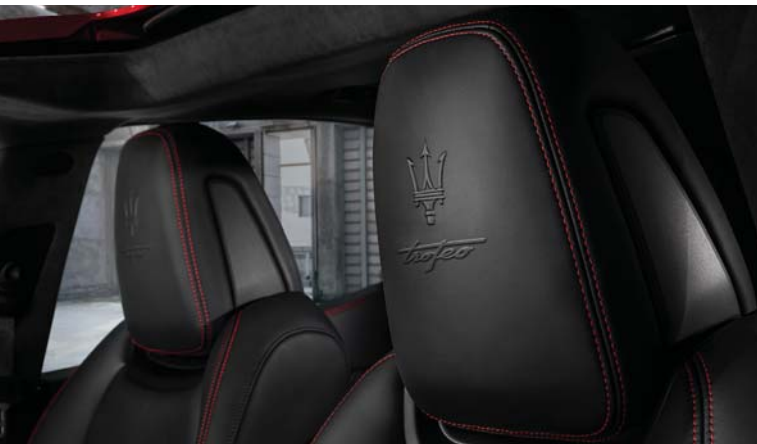
Ghibli Trofeo - Headrest detail