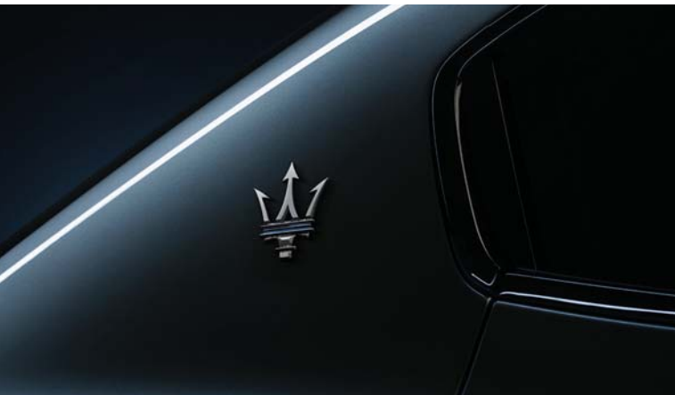
Ghibli GT Hybrid - Trident logo on C-pillar