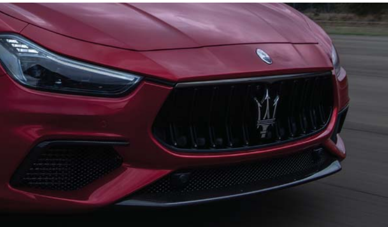
Ghibli Trofeo - Grille