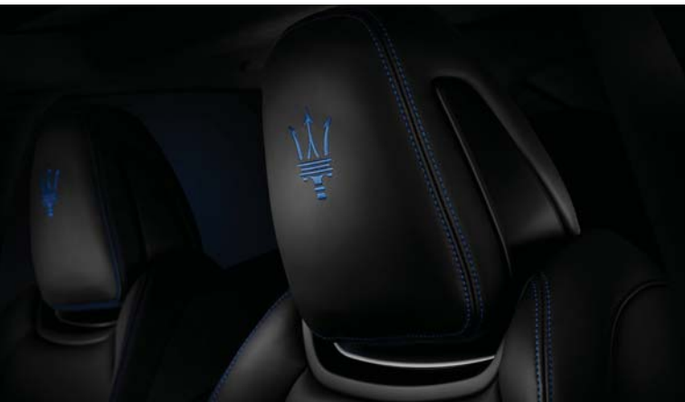
Ghibli GT Hybrid - Headrest detail