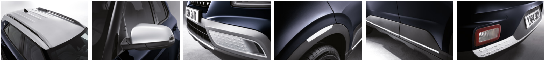
데님 블루 펄/초크 화이트 메탈릭 투톤

투톤 루프 컬러는 총 2종(초크 화이트 메탈릭/어비스 블랙 펄)입니다. 초크 화이트 메탈릭 루프 선택 시, 컬러포인트는 초크 화이트 메탈릭 컬러로 적용됩니다. 어비스 블랙 펄 루프 선택 시, 아웃사이드 미러는 어비스 블랙 펄 컬러로 적용되며 그 외 컬러포인트는 바디 컬러로 적용됩니다.