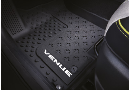
프로텍션 매트 패키지(플로어 매트, 러기지 프로텍션 매트)