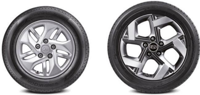
185/65R15 타이어 & 15인치 알로이 휠