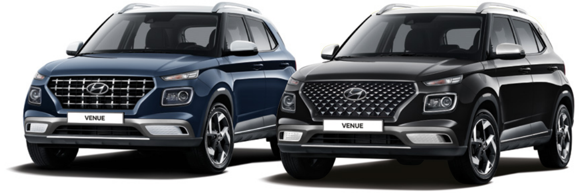
프리미엄 풀옵션(데님 블루 펠/초크 화이트 메탈릭 투톤) / 플렉스 풀옵션(어비스 블랙 펠/초크 화이트 메탈릭 투톤)