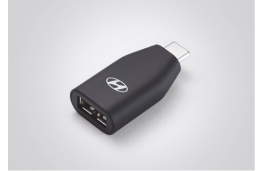
C to USB-A 변환 젠더* A to USB-C 변환 젠더*