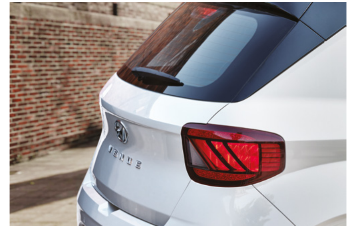
LED 리어 콤비램프 17인치 알루미늄 휠 & 타이어