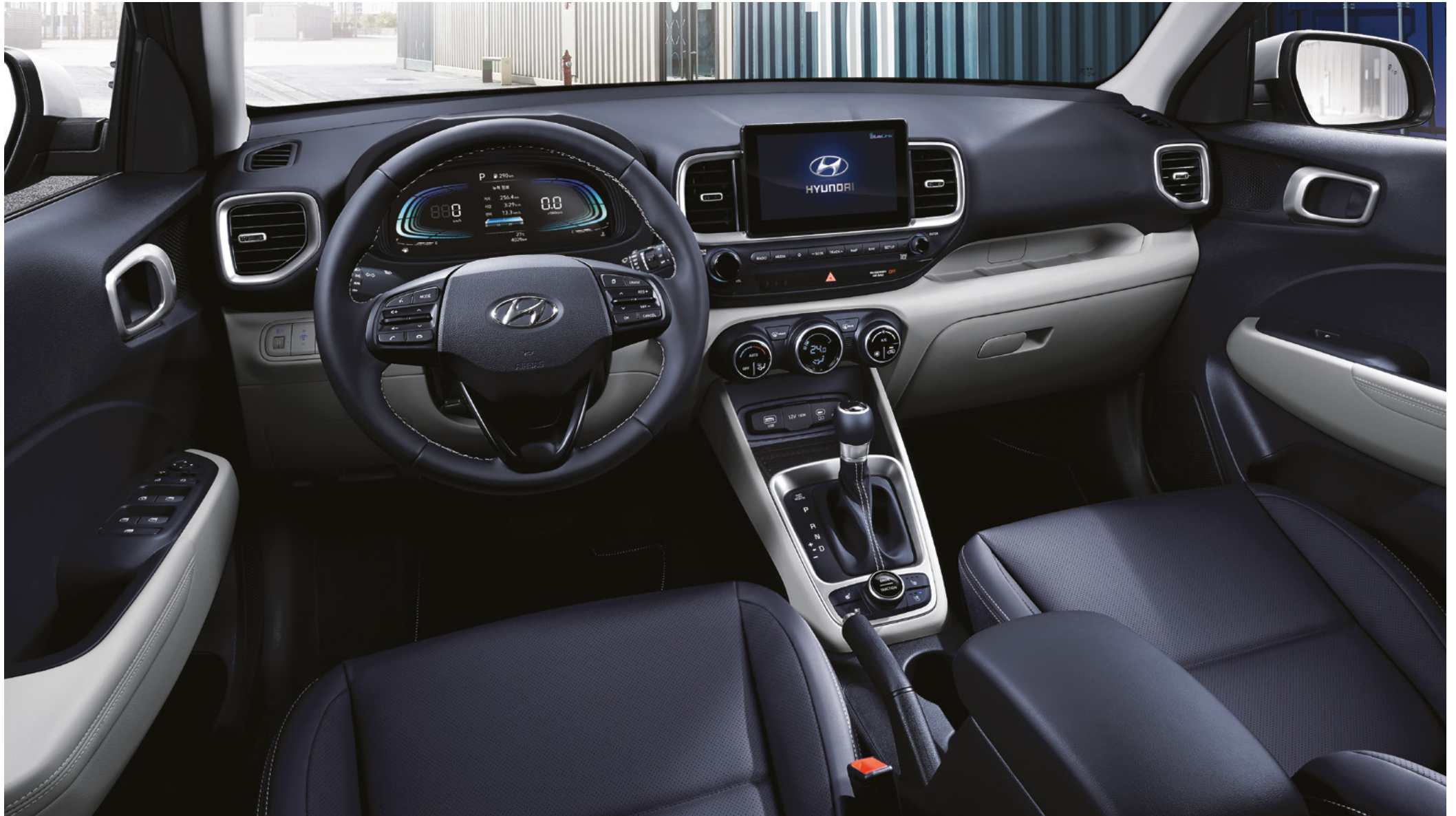
프리미엄 풀옵션(메테오 블루)

* 인포테인먼트 시스템 화면 이미지는 업데이트에 따라 변동될 수 있습니다.