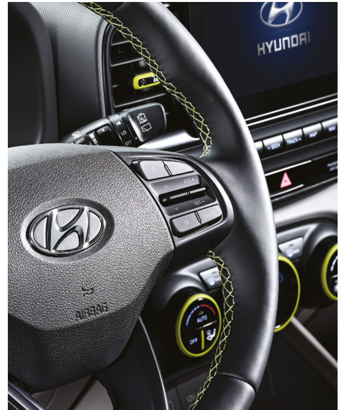
가죽 스티어링 휠 (FLUX 전용 스티치 포함)