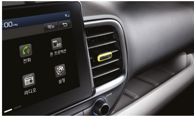
에어벤트 풀오토 에어컨