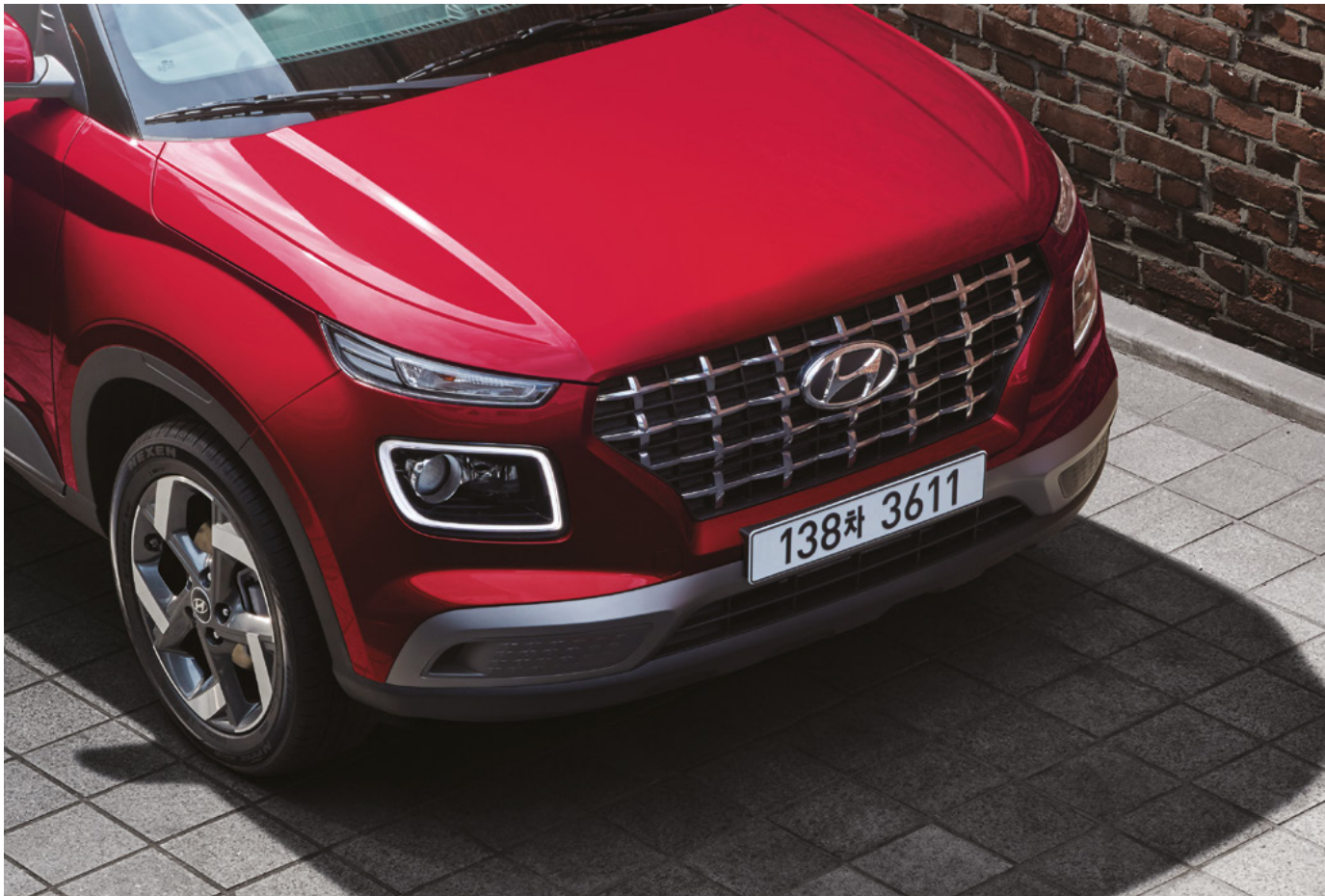
캐스케이딩 그릴 / LED 헤드램프