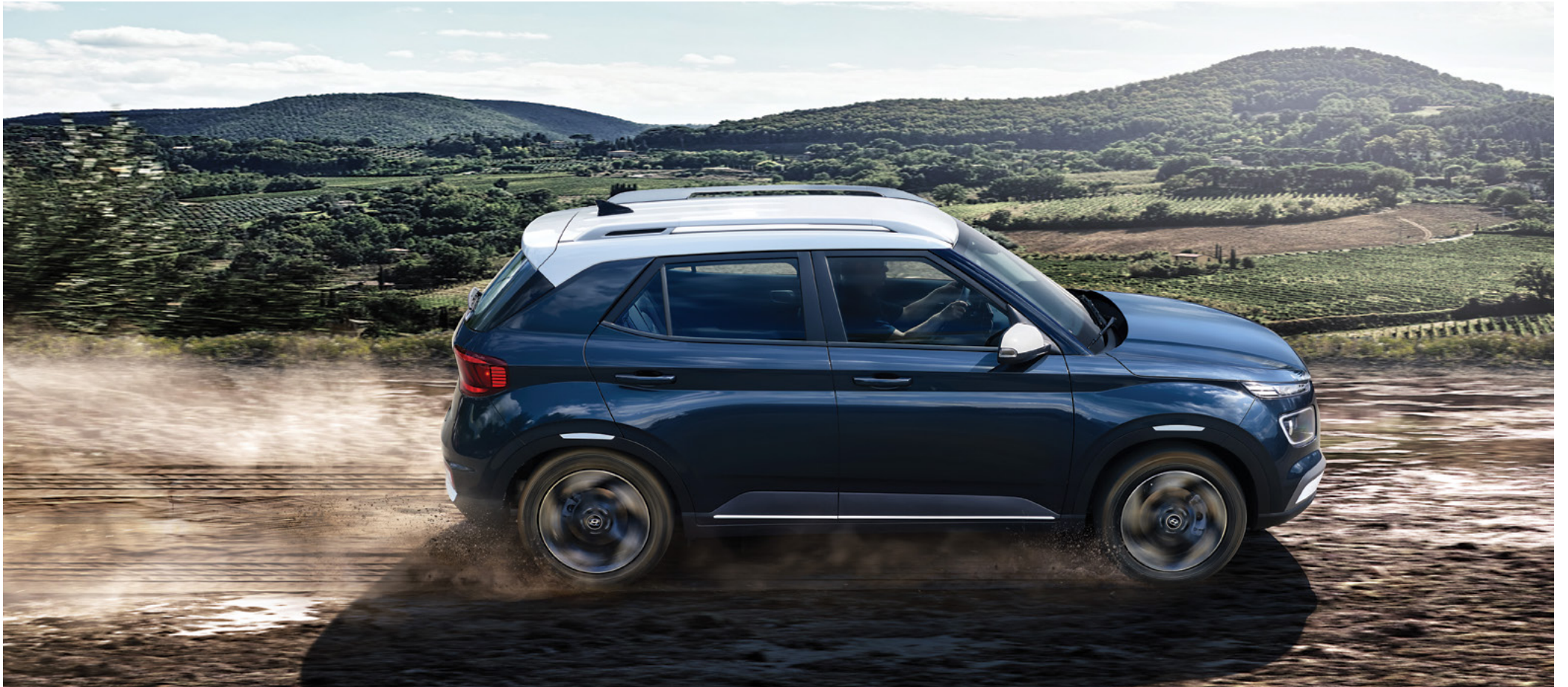
프리미엄 풀옵션(데님 블루 펄/초크 화이트 메탈릭 투톤)