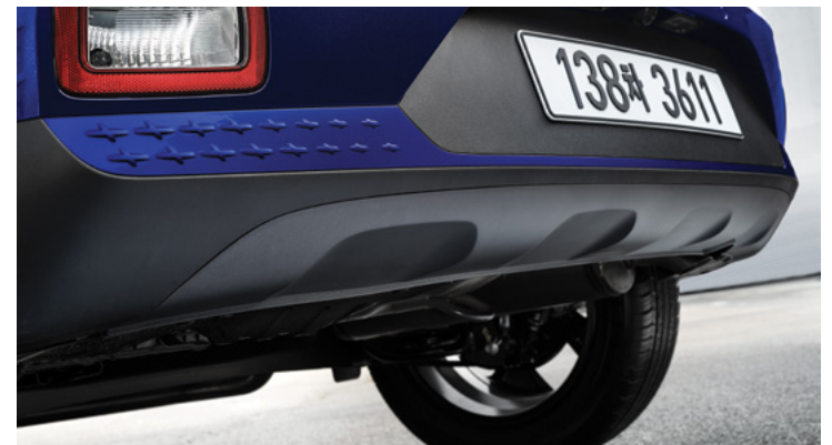
C필러 배지 FLUX 전용 리어스키드