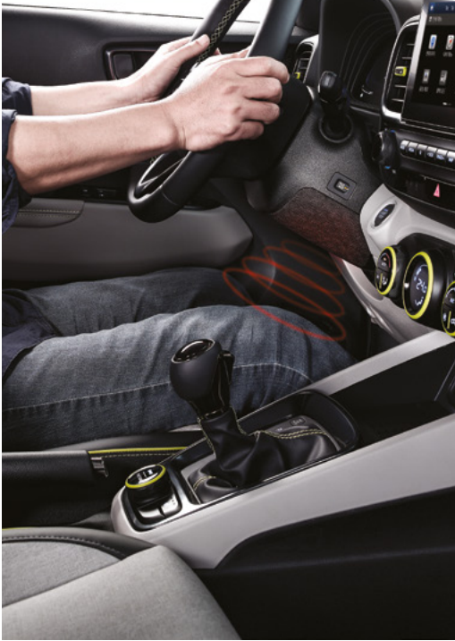
적외선 무릎 워머