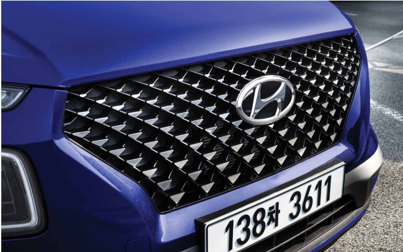
FLUX 전용 핫스탬핑 라디에이터 그릴