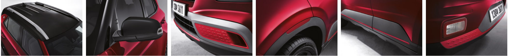
얼티메이트 레드 메탈릭/어비스 블랙 펄 투톤