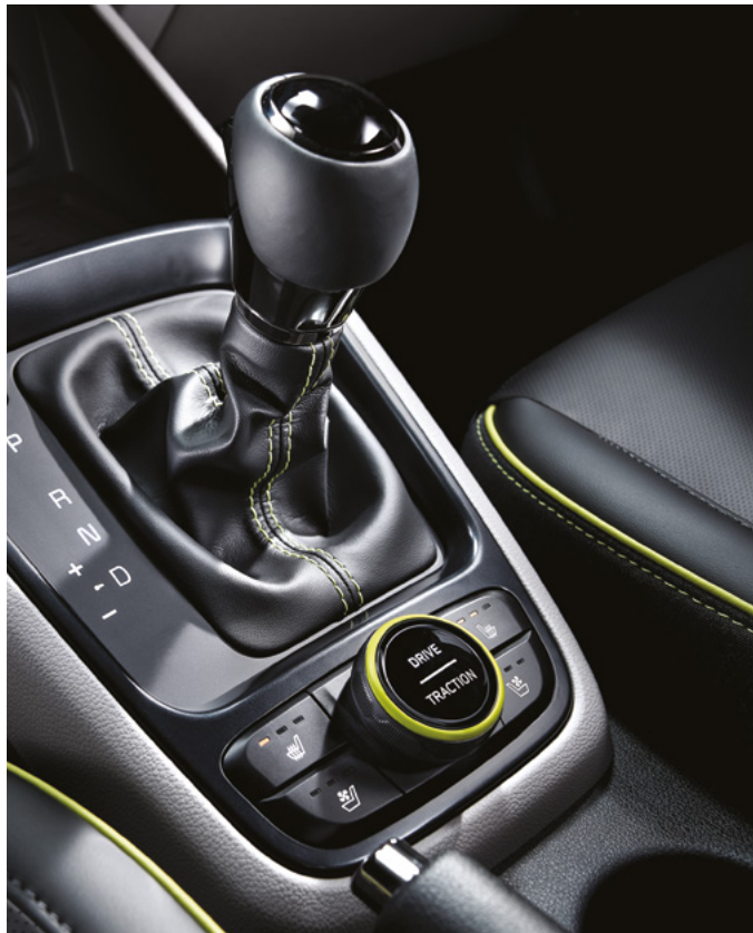
기어노브 & 2WD 험로 주행 모드 스위치