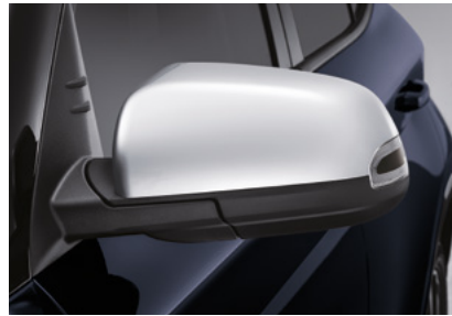
아웃사이드 미러(열선, 전동접이, 전동조정, LED 방향지시등) 8인치 내비게이션