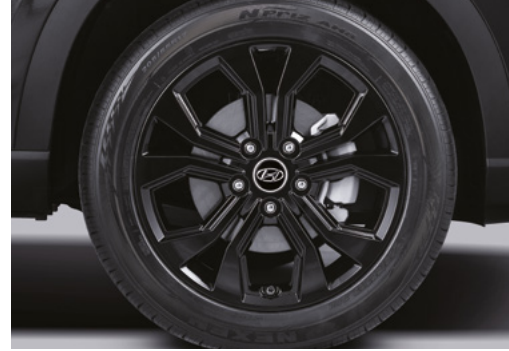
17인치 블랙 알로이 휠 프리미엄 스피커(케블라콘)