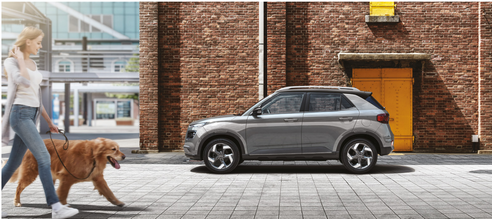
프리미엄 풀옵션(사이버 그레이 메탈릭/어비스 블랙 펠 투톤)